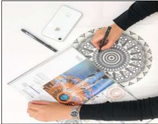
صورة رقم (1) توضح لمستوى الأول في رسم الماندالا .