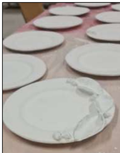
صورة رقم (6) توضح مرحلة تجفيف الأطباق.

- يُراعى تغطية الطبق بقطعة قماش رطبة إذا استغرق وقت التجفيف طويلاً لتجنب الجفاف السريع.