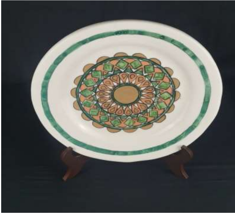
صورة (13) العمل الخامس - عمل الطالبة رحاب فايز المطيري