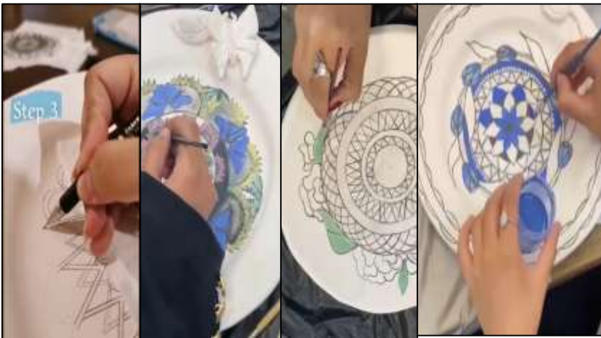
صورة رقم (8) توضح طريقة رسم الماندالا على الاطباق من قبل الطالبات مع استخدام ألوان تحت الطلاء .