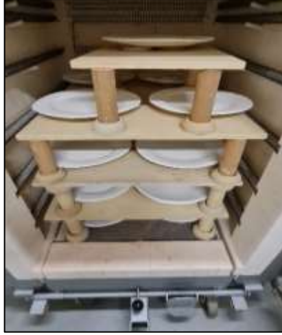
صورة رقم (7) توضح عند إدخال الأطباق الخزفية بالفرن للبدأ بالتشغيل