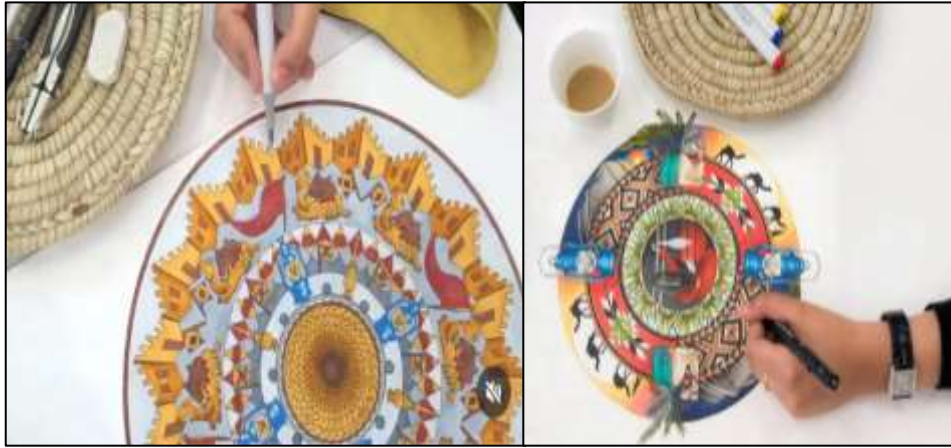
صورة رقم (3) توضح لمستوى الثالث في مراحل تعلم الماندالا .