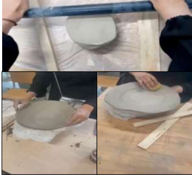
صورة رقم (5) توضح لطريقة فرد الطينة وبناء الطبق