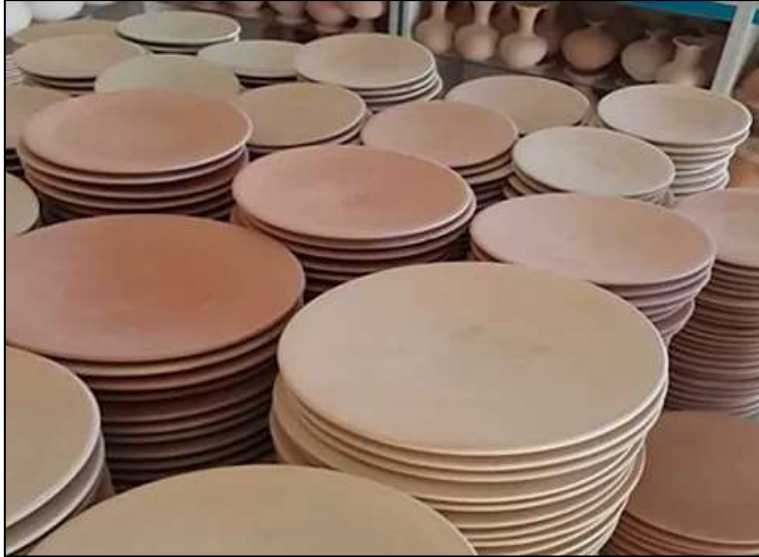
صورة رقم (4) توضح لأشكال الاطباق الخزفية وأنواعها.

الحياة اليومية، حيث تُستخدم لتقديم الطعام في المناسبات الاحتفالية ولتزيين الموائد بأسلوب فني يعكس الابتكار والذوق الرفيع . وتُعدّ الأطباق الخزفية جزءًا من التراث الثقافي والفني، حيث تعكس مهارة الحرفيين وتطور التقنيات الفنية عبر الزمن، مما يجعلها رمزًا للجمال والابتكار في فن الخزف (صورة رقم 4) (27) .