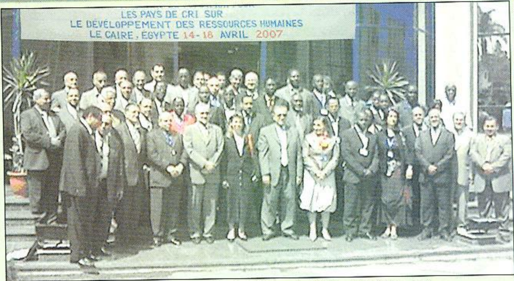
الوفود المشاركة في حلقة العمل حول التنمية البشرية مع السيد رئيس الهيئة والسيد سكرتير عام المنظمة أمام مبنى مركز القاهرة الإقليمي للتدريب

■ قيادات الهيئة والمنظمة العالمية للأرصاد الجوية أثناء حفل الافتتاح ■