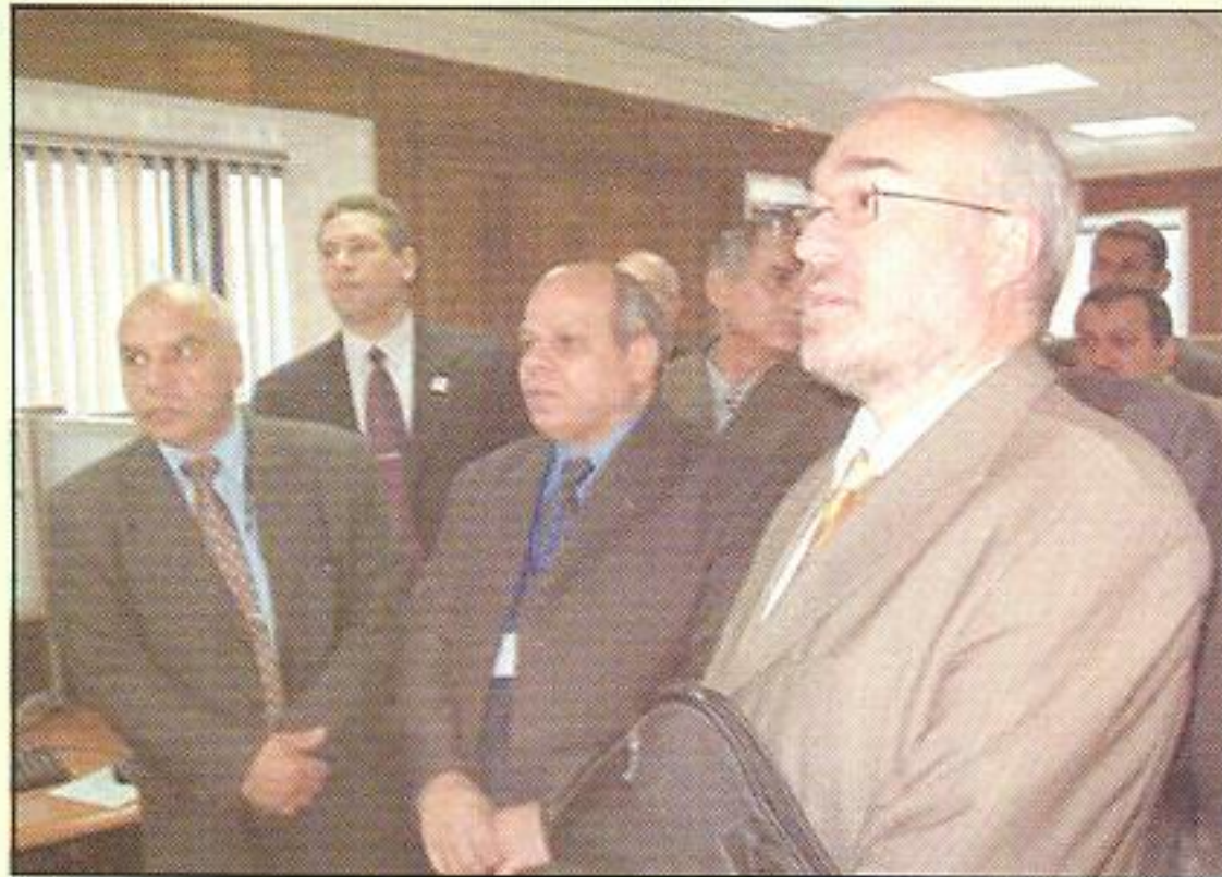
زيارة السيد سكرتير عام المنظمة العالمية للأرصاد الجوية لمركز التنبؤات العددية بمبنى مركز القاهرة الاقليمي للتدريب.

وقد عقد المشاركون ١٧ جلسة عمل، بدأت بدراسة نظرية لعدد من أساليب تحليل القوى البشرية ونظم بناء المؤسسات ثم بدأ الجانب العملي بتقسيم المشاركين إلى ثلاث مجموعات عمل تناولت كل