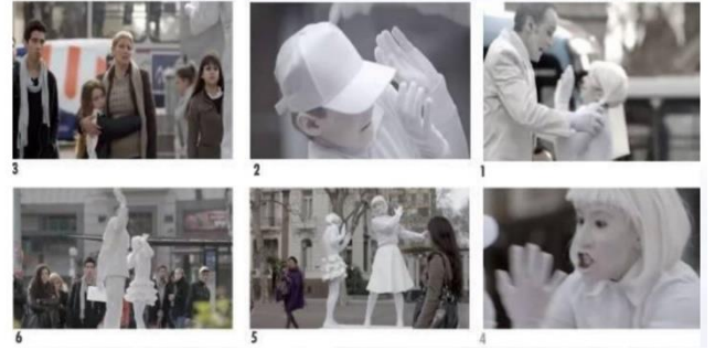
شكل ( 10 )

إعلان يهاجم أكل اللحم وتشبيهم بأكل لحم البشر وكتابة جملة (أن من يأكل اللحم فهو قاتل) بوضع أناس بحجمهم الطبيعي بداخل أكياس تغليف الطعام في الشوارع والأماكن العامة لاجداث صدمة للمارين https://www.peta.org.au/news/human-meat-australia/