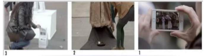
شكل ( 11 )

تقدم الفكرة الإعلانية بأسلوب درامي حركي صامت لتكون أقرب إلي الجمهور المتلقي ، فالتفاعلية هنا واقعية ومباشرة حيث تعتمد علي خلق الصدمة عند المشاهد واستخدام العنصر الإنساني في التفاعل وتحريك مشاعر الجمهور ، وقد تدخل التقنيات كوسيط عن طريق ما يراد نشره في مواقع التواصل الإجتماعي كونها حالات فيها إرشاد وتوجيه للمجتمع كما في شكل (11)