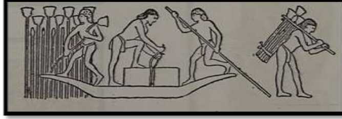
شكل (٣) نقش جداري يوضح عملية جمع نبات البردي بمصر القديمة ١

وانتقلت صناعة الورق مع تطور العصور حتى العصر الإسلامي لحفظ الدواوين وغيرها من الكتابات " كثر استخدام ورق البردي بعد فتح العرب لمصر فاستخدمه الفاتحون ، ونشر في انحاء الدولة الإسلامية ويذكر جروهمان انه كما كان البردي وسيلة للحياة الفكرية في مصر وثقافتها القديمة لمدة أربعين قرنا ، ظل كذلك مادة للثقافة الإسلامية مدة ثلاثة قرون علي الأقل ٢ فأبدع المصريون في صناعة البردي فخصائصه التي شجعت علي جعله صالح للكتابة جعلته يكون مصدر لكثير من البلدان "وقد سيطرت مصر علي انتاج ورق البردي من نبات البردي الموجود علي أرضها لفترة طويلة من الزمن وكانت تتحكم غي تصديره الي معظم دول العالم القديم سواء هيئة افرخ أو في صورة لفافات" ٣ ولكن مع التطور الكبير عبر العصور في صناعة الورق واهمال البردي لم يحظى بأي اهتمام وبدا يتقلص زراعته ولكن في قرية القراموص وجد الدكتور أنس مصطفى عام ١٩٧٧ فيها تربة خصبة وبدا زراعة البردي بها مما حول هذه القرية الي مزرعة كبيرة للبردي يعمل بها الرجال والنساء والأطفال بل تورث من أجيال لأجيال.