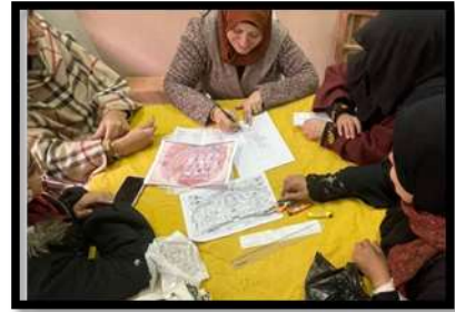
شكل (٥) صور لبعض المتدربات (عينة البحث) أثناء الاعداد لتصميم المشغولات الفنية.