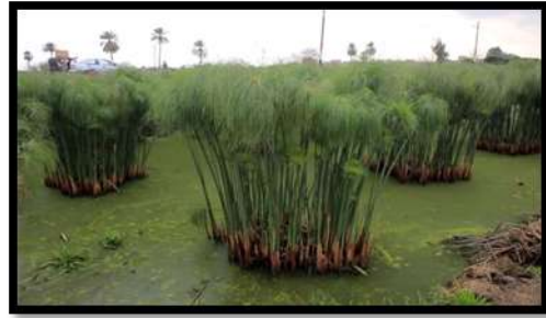
شكل (٢٠١) يوضح زراعة البردي

كما أن المصري القديم كان يستخدم البردي في العديد من الاستخدامات في الحياة اليومية منها الطعام للجزء السفلي للنبات فقد أكد هيرودوت ان المصريين كانوا ينقعوا البردي ويقطعونه الي أجزاء "والذي يتبقى منه وطوله زراع يأكلونه أو يبيعونه" كما كان يستخدم في صناعة الحبال والحصير والنعال والاعراض الطبية وتغليف جثث الموتى.