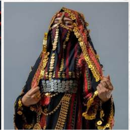
نماذج من تراث الضفة الشرقية