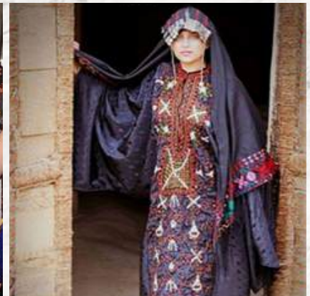
نماذج من تراث الضفة الغربية