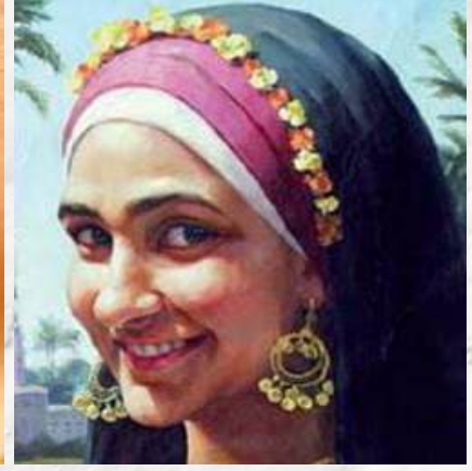
نماذج من تراث الوجه البحري