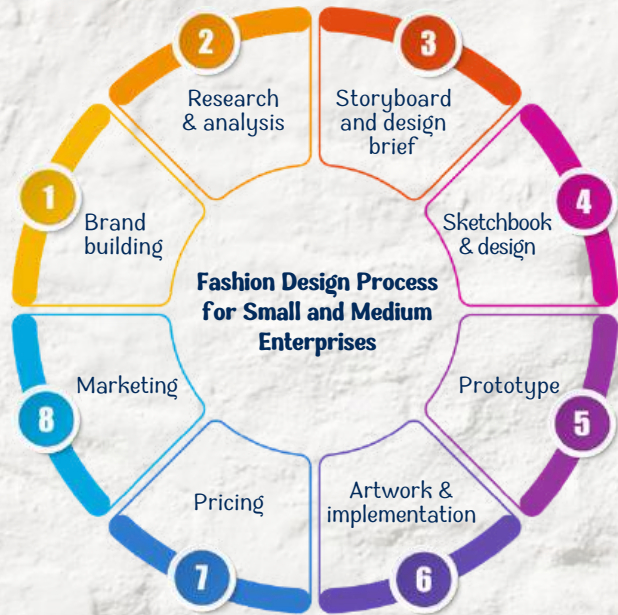
عملية تصميم الأزياء للمؤسسات الصغيرة والمتوسطة