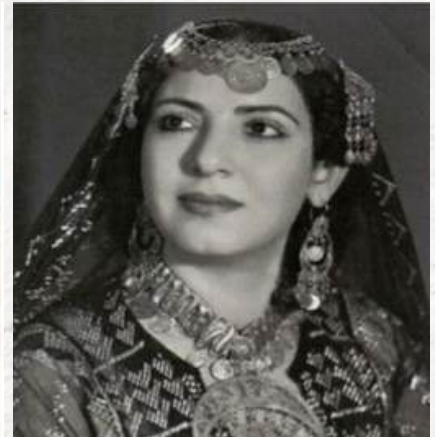
نماذج من تراث الوجه القبلي