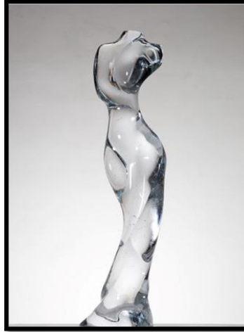
شكل (٣) (٤)

تناول النحات الشفافية بطريقة مختلفة عن النحاتين الاخرين، واسلوب خاص من الامكانيات التشكيلية للفكر الابداعي، حيث ظهر تنوع في الأداء والتعبير والمعالجة التقنية طبقا لمعطيات الخامة المستخدمة وان لكل عمل نحتي له مضمون مستمد من التغيرات الفكرية التي تواكب عصره . وان خامة الزجاج هو افضل طريقة لتحقيق رؤاه الفنية والجمالية من خلال فهمه للقوة الجذابة للشفافية . كما هو موضح في شكل (٣)