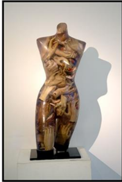
شكل (١) (٢)

استطاع النحات ان ينطلق بخياله ليعبر عن رؤيته المعاصرة في تشكيل الشكل الانساني خاصة تلك الرؤية التي لا يمكن ان ينفذها بالخامات التقليدية، واصبحت عملية اختيار الخامة والشكل والتقنية لإظهار العمق الفلسفي للعمل هو محور العملية الابداعية ومقياس الابتكار للعمل النحتي .