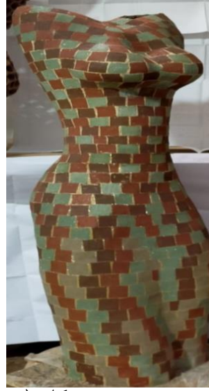
شكل (٢٢) حاملة القربان

عمل رقم (٣) شكل (٢٢) بعنوان حاملة القربان ابعاده كالتالي عرضه (٤٠سم), عمقه (٣٥سم), وارتفاعه (٤٥سم), وقد استخدمت الباحثة أسلوب الشرائح لبناء هذا العمل واللون بشكل اساسي لابرز القيم الجمالية.