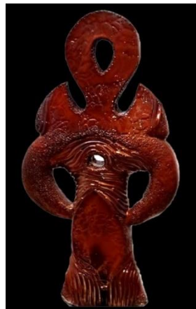
شكل (٢١) عنخ

عمل رقم (٢) شكل (٢١) بعنوان عنخ ابعاده كالتالي عرضه (٣٥سم), عمقه (١٢سم), وارتفاعه (٦٠سم), وقد استخدمت الباحثة أسلوب الشرائح والحبال لبناء هذا العمل واللون بشكل اساسي لابرار القيم الجمالية.