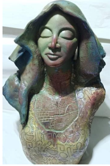
شكل (٢٤) فلاحه

عمل رقم (٥) شكل (٢٤) بعنوان فلاحه ابعاده كالتالي عرضه (٣٨ سم), عمقه (٢٩ سم), وارتفاعه (٦٥ سم), وقد استخدمت الباحثة أسلوب الشرائح لبناء هذا العمل واللون بشكل اساسي لابرار القيم الجمالية.