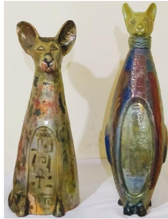
شكل (٢٠) قطتي

عمل رقم (١) شكل (٢٠) بعنوان قطتي ابعاده كالتالي عرضه (٣٠سم), عمقه (٣٠سم), وارتفاعه (٩٥سم), وقد استخدمت الباحثة أسلوب الشرائح والحبال لبناء هذا العمل واللون بشكل اساسي لابرار القيم الجمالية.