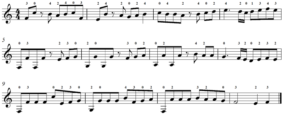
شكل (9) التدريب الثاني المقترح من مقام الليديان

التدريب التكنيكي الثاني من مقام الليديان: يهدف إلى التدريب على المسافات اللحنية وكذلك تبادل العزف بين قرار وجواب المقام كما في م 5: 8 والنغمات المتكررة كما في م 9: 11