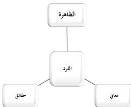
شكل رقم (١): يوضح منحى المنهج الظاهري في اعتماده على المشارك

وهو يهتم باستخلاص المعنى من الخبرة التي يعيشها المبحوث تجاه الظاهرة المدروسة، فهو منهج يدرس المعاني التي تكونت لديهم أثناء تواجدهم في سياق الظاهرة، ويركز على التجربة الذاتية فيها، وكيف يفسرونها، وما هي مشاعرهم الشخصية تجاهها، ووفقاً لـ (عبد الكريم، ٢٠١٢م) فإن الظاهرية منحى يفترض وجود واقع ذات سياق اجتماعي، وأن لهذا الواقع نظرة معينة يقدمها الفرد من خلال تجربته الذاتية، وينظر فيها الباحث للمشاركة على أنه مشارك في تفسير الظاهرة من خلال ما يقدمه من معاني وحقائق عنها تساعده في الوصول للنتائج النهائية يوضحها الشكل التالي: