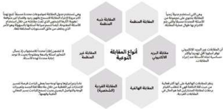
شكل رقم (٢): أنواع المقابلة النوعية

وهناك أنواع رئيسة للمقابلات، هي: (Frances et al., 2009)