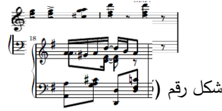
شكل رقم (16)