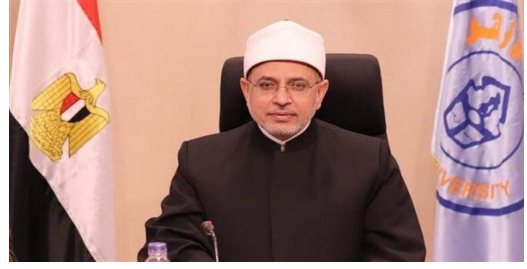
فضيلة أ.د: سلامة داوود رئيس جامعة الأزهر