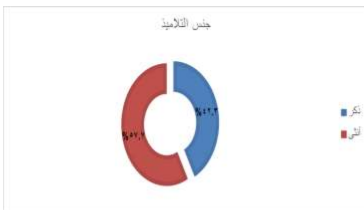
الشكل رقم (١): يمثل توزيع بيانات عينة الدراسة وفق متغير الجنس