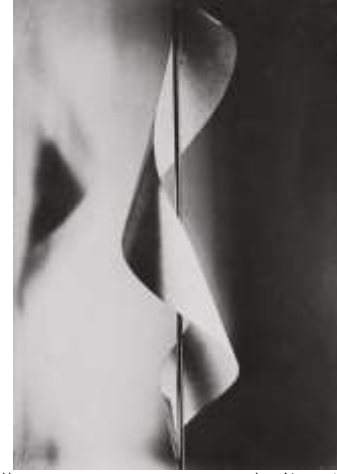
شكل (4) لوحة ( ظل المصباح ) Lamp shade للفنان مان راى 1920

ولذلك أصبحت الصورة وسيلة تعبير أساسية في فن البوب أرت كان ذلك من خلال عدة أنماط وأشكال متنوعة فكانت أحيانا العنصر الرئيسي والكلي للعمل الفني وكانت أحيانا عنصر يستخدم من خلال تقنيات الإظهار والمعالجة والطباعة في العمل الفني، وذلك من خلال حربة التلاعب والتركييب الصوري وإعادة البناء والتشكيل واستخدام لقطات مكبرة أو مصغرة وتغيير الظل والنور والتلاعب من خلال مزج الألوان، ولذلك كان توظيف الصورة الفوتوغرافية كبيراً جداً وكان متجها نحو الثقافة الجماهيرية الشعبية مثل الصور الشعبية المتداولة وصور الإعلانات والصحف وصور الأحداث اليومية أي أنه كان بعيداً عن المرجعية الذاتية للفنان بل أن مرجعيته كانت نحو العالم الجماهيري، وكان إدخال الصورة الفوتوغرافية للعمل الفني بمثابة إدخال حقيقة واقعة داخل التكوين ومحاولة إقناع المتلقي بالحقيقة وكان هذا من الأمور التي تميز بها فن العامة أو فن البوب أرت. (البيسوني، 2001)