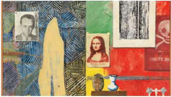
شكل (7) سباق الأفكار للفنان جاسبر جونز 1983

ولذلك أصبحت الصورة وسيلة تعبير أساسية في فن البوب أرت كان ذلك من خلال عدة أنماط وأشكال متنوعة فكانت أحيانا العنصر الرئيسي والكلي للعمل الفني وكانت أحيانا عنصر يستخدم من خلال تقنيات الإظهار والمعالجة والطباعة في العمل الفني، وذلك من خلال حربة التلاعب والتركييب الصوري وإعادة البناء والتشكيل واستخدام لقطات مكبرة أو مصغرة وتغيير الظل والنور والتلاعب من خلال مزج الألوان، ولذلك كان توظيف الصورة الفوتوغرافية كبيراً جداً وكان متجها نحو الثقافة الجماهيرية الشعبية مثل الصور الشعبية المتداولة وصور الإعلانات والصحف وصور الأحداث اليومية أي أنه كان بعيداً عن المرجعية الذاتية للفنان بل أن مرجعيته كانت نحو العالم الجماهيري، وكان إدخال الصورة الفوتوغرافية للعمل الفني بمثابة إدخال حقيقة واقعة داخل التكوين ومحاولة إقناع المتلقي بالحقيقة وكان هذا من الأمور التي تميز بها فن العامة أو فن البوب أرت. (البيسوني، 2001)