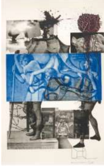
شكل (6) لوحة Bellini للفنان روبرت راوشنبرج 1988

والأحداث الشعبية المتداولة والأقوال الرائجة والشائعة ومبتكرات التكنولوجيا المعاصرة وغيرها من المواد الأخرى، وأصبحت تلك العناصر بمثابة مواد خام لجميع أعمال فناني البوب أرت وذلك حتى يثير الفنان انتباه المتلقي، حيث كانت هذه العناصر تكون مناخات وأفاق فنية جديدة ليكون مساحات بصرية مكونة من تقنيات مختلفة (الزبيدي، 2017)، وبالتالي ظهرت الصورة الفوتوغرافية كعنصر أساسي في البناء التشكيلي في الكثير من أعمال فناني البوب أرت مثل لوحة Bellini للفنان الأمريكي "روبرت راوشنبرج" التي دمج فيها الصورة الفوتوغرافية والصور المطبوعة والرسم كما يظهر في شكل (6) (Robert Raushenberg)، وأيضاً الفنان "جاسبر جونز" الذي دمج أيضاً بين الصورة الفوتوغرافية وضربات الفرشاة في الشمع المصطبغ المتكثف كما نرى في شكل (7) في لوحة سباق الأفكار. (Schjeldahl, 2021)