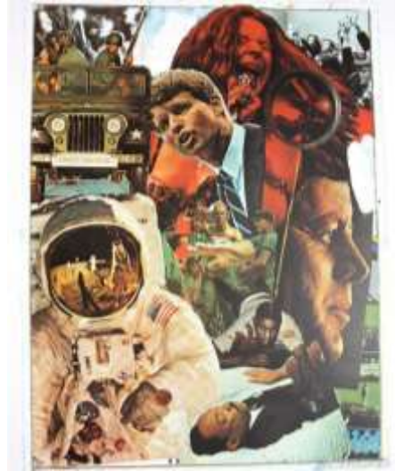
شكل (9) لوحة (علامات Signs) للفنان روبرت راوشنبرج 1970

وفي شكل (12) نرى لوحة (الطبيعة الصامتة 1963 Still Life) للفنان "توماس ويسيلمان Thomas Wesselmann" وهو فنان أمريكي ومن رواد فن البوب آرت ولعب دور كبير في تعريف هذا الفن وكانت لوحاته تتضمن مزيج من الرسومات التخطيطية وقصاصات من ورق الحائط ولوحات الإعلانات المطبوعة والصور الفوتوغرافية ودمج بين فن الرسم والنحت والكولاج والتصوير الفوتوغرافي، وتضمنت عناصر أشياء وأدوات وظيفية واستخدم لوحات قماشية وكان يقوم بترتيب عناصره فيها على شكل