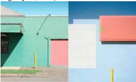
شكل (21) لوحة من أعمال الفنان جورج بيرن George Byrne

شكل (20) لوحة من أعمال الفنان زيرين بادار Zeren Badar ومن فناني البوب أرت أيضاً الفنان "جورج بيرن George Byrne" والذي قام بالتقاط صور فوتوغرافية تصور الأسطح والمناظر الطبيعية اليومية بشكل جديد مستوحى من الحياة الحضرية اليومية، ونرى بعض من أعماله في شكل (21) وشكل (22). (George Byrne, 2024)