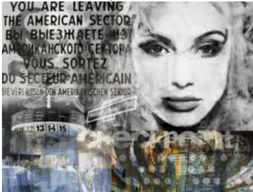
شكل (14) لوحة من سلسلة Diva للفنان سفن بيفرومر Sven Pfrommer