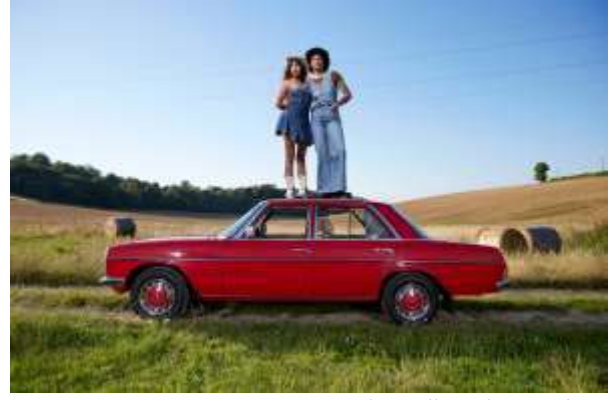
شكل (16) لوحة للفنانة الكسندرا كينجو Aleksandra Kingo