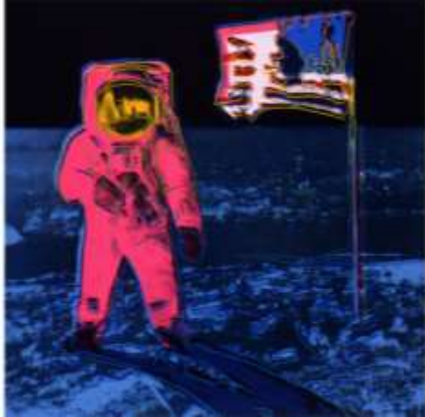
شكل (11) لوحة (المشى على سطح القمر Moonwalk) للفنان أندي وار هول 1987

وفي شكل ( 11 ) نجد لوحة أخرى للفنان "أندي وار هول Andy Warhol" وقد قام بابتكار هذا العمل الفني لإحياء ذكرى الإنجاز التاريخي لصعود أول رجل على سطح القمر حيث يظهر في اللوحة صورة لرائد فضاء يقف على سطح القمر حاملاً العلم الأمريكي، وكانت هذه الصورة من رموز فن البوب آرت واستخدم فيها أندي وار هول صورة فوتوغرافية مع إضافة طبقات من الألوان النابضة بالحياة من اللون الأصفر واللون الوردي وهكذا كما نرى في أسلوب "أندي" لا نرى أعمالاً نموذجية بل نرى صوراً من الحياة مضافاً لها تقنياته وإحساسه التي تجعل الجمهور يتأمل كل ما هو عادي وذلك عن طريق تلاعبه بتقنيات فن البوب آرت. (Hess, 2014)