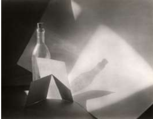
شكل (2) لوحة للفنان جارومير فانك Jaromir Funke

وكانت الصورة الفوتوغرافية من أهم وسائل التعبير أيضاً في الفن التكعيبية ففي عام 1982 تم افتتاح معرض التكعيبية والفوتوغرافيا الأمريكية بالمتحف العالمي للفوتوغرافيا وركزت التكعيبية على فكرة النظر إلى الأشياء من خلال الأجسام الهندسية وخاصة المكعب وظهر تأثر العديد من الفنانين التكعيبيين بالفوتوغرافيا مثل الفنان "بول ستراند Paul strand والفنان "ياروسلاف روسلر Jaroslav Rössler" ونرى في شكل (3) لوحة للفنان ياروسلاف روسلر (1924-1923) وهي لوحة الحنين الطبيعي . (Skylight Mcaedle, 2017)