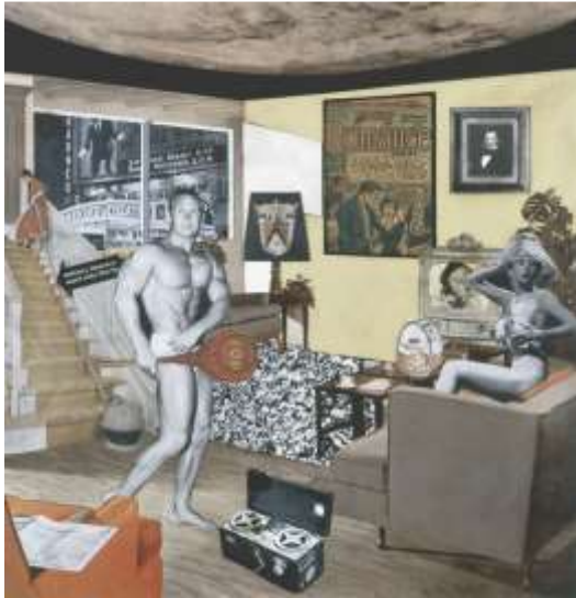
شكل ( 8 ) لوحة (ما الذي يجعل منازل اليوم مختلفة جداً وجذابة جداً؟) للفنان ريتشارد هاملتون

من أهم أعمال فن البوب أرت، وكان "ريتشارد هاملتون" فنناً بريطانياً ومن أحد أهم الشخصيات في حركة فن البوب وكان مشهوراً بتعليقاته النقدية على الإعلانات والعلامات التجارية ووسائل الإعلام.