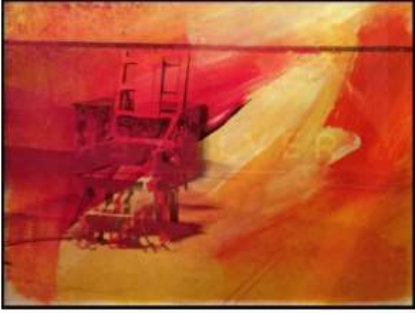
شكل (10) لوحة ( الكرسي الكهربائي Electric Chair ) للفنان أندي وار هول 1971

وفي هذه لوحة الكرسي الكهربائي يوجد كرسي في منتصف الغرفة، وسله يتدلى خارج الإطار، وعلى الرغم من أن الظلال تشير إلى مزاج شرير وكنيب، إلا أن إعادة تلوين أندي للصورة بأكملها تجذب الانتباه إلى المشهد وليس إلى الشيء، وينقلب السياق رأساً على عقب ولأول مرة تقريباً وجد الجمهور موضوع الموت وقد أصبح خاضعاً لمزيد من التأمل، ويتم إعادة وعي الجمهور بالعنف المتأصل فيه.