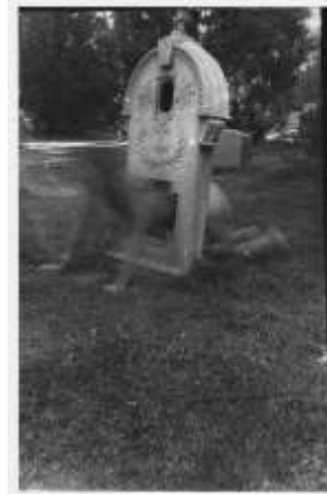
شكل (5) لوحة للفنانة فرانشيسكا وودمان 1975

وهكذا نجد أن الصورة الفوتوغرافية وسيلة تعبير هامة في الفنون التشكيلية بجميع مدارسها الفنية وبالتالي كانت أيضاً وسيلة تعبير هامة في فن البوب أرت وفيما يلي سوف نتحدث عن الصورة الفوتوغرافية وعلاقتها بفن البوب أرت.