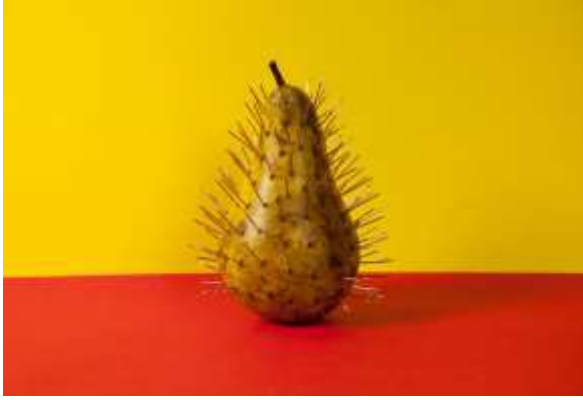
شكل (19) لوحة من سلسلة (اقتراحات تقديم) للفنانة باتريشيا توبين