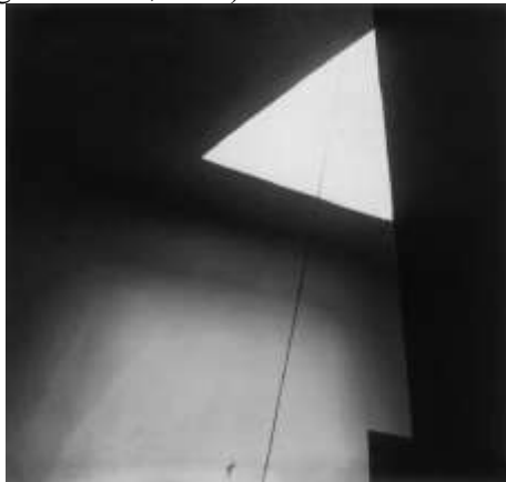
شكل (3) لوحة الحنين الطبيعي Skylight للفنان ياروسلاف روسلر (1924-1923)