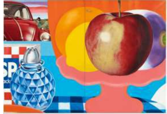
شكل (12) لوحة (الطبيعة الصامتة Still Life) للفنان توماس ويسيلمان 1963

لوحات تعبر عن المجتمع الاستهلاكي ويضيف فيها لمستته الفنية والتي رفض فيها المبادئ التعبيرية والتجريدية والتي كانت سائدة في خمسينيات القرن العشرين حيث عمل على إعادة صياغة عناصره وأضاف ضربات من الفرشاة بتكوينات مبتكرة وجديدة، وفي هذه اللوحة تصور "ويسيلمان" أشياء عادية مرتبة على طاولة مطبخ بما في ذلك وعاء الفاكهة وصورة فوتوغرافية لتفاحة وليمون وبرتقال بالألوان الزيتية وأضاف أيضاً سيارة فولكس فاجن لتعبر عن المجتمع الاستهلاكي وصورها كما لو كانت عبر نافذة المطبخ الخيالي لويسيلمان. (Page1, 2018)