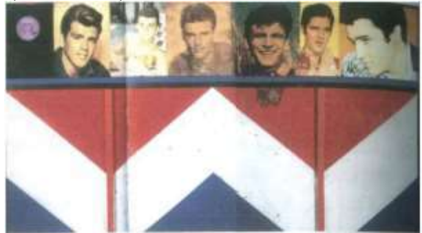
شكل (13) نرى لوحة (حصلت على فتاة Got Girl) للفنان بيتر بلاك 1960

وفي شكل (13) نرى لوحة (حصلت على فتاة Got Girl 1960) للفنان "بيتر بلاك Peter Blake" والذي يُعد من أكثر المشاهير الذين ينتمون للجيل الأول من فناني البوب في بريطانيا، وقد مثل من خلال أعماله الشعب البريطاني في فترة الستينات وكانت أعماله تنحصر في إطار مجموعات من الصور الفوتوغرافية والمخطوطات والكروت والعرائس والزجاجات، واستخدم العديد من التقنيات مثل الكولاج وأعمال الحفر على الخشب والألوان المائية والكتابة باليد والنحت كل ذلك في إطار شكل تصويري شعبي وفي لوحته حصلت على فتاة Got Girl نجد أنه يحتوى هذا العمل على شريحة من الصور لنجوم الغناء الأمريكيين وقد تم ذكر أسمائهم في سجل تم تثبيته في الجانب الأيسر من اللوحة وهم من اليسار إلى اليمين "فابيان Fabian"، "فرا نكي أفلون Frankie Avalon"، "ريكي نيلسون Richie Nelson"، "بوبي رايدل Bobby Rydell"، "ألڤيس بريسلي Elvis Presley" وكانت هذه اللوحة تنقل قصة ويدعمها الكلمات الموجودة بالأغنية للتعبير عن حب الفنان الشديد لهؤلاء المطربين حيث أن الألبان نفسها قد جرى معالجتها حتى تساهم في المعنى الذي تتسعى اللوحة إلى توصيله. (البغدادى، 2016)