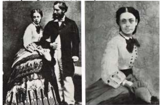
شكل (1) لوحة للفنان ديجا Degas

وبذلك أصبحت الصورة الفوتوغرافية وسيلة تعبيرية في الكثير من الحركات الفنية وكانت الحركة الانطباعية هي أول حركة فنية تم تشكيلها من خلال التصوير الفوتوغرافي حيث أكتشف الانطباعيون أبعاداً أخرى للصورة الفوتوغرافية مثل الضوء والحركة واللون وابتكروا تصوراً مختلفاً للواقع وأدركوا أن الواقع يجب أن يكون في حركة مستمرة أي أن اللوحة في الحركة الانطباعية تمثل الواقع كما تراه العين البشرية، وأن الرسم لا يتنافس مع التصوير الفوتوغرافي بل أنهم مكملين لبعضهم البعض ومن أهم فناني الحركة الانطباعية الذين تأثروا بالتصوير الفوتوغرافي كان الفنان ديجا Degas والذي استخدم تقنية التعريض الطويل في الكاميرا ليحقق تأثير الحركة الناعمة والسلسلة كما نرى في شكل (1). (Muybridge, 2015)