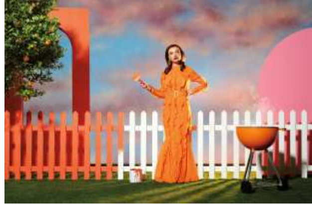
شكل (17) لوحة للفنانة الكسندرا كينجو Aleksandra Kingo

ومن الفنانين المعاصرين أيضاً اللذين تأثروا بفن البوب أرت الفنانة "باتريشيا توبين Patricia Tobin" وكانت متأثرة بفناني البوب أرت وخاصة الفنان "أندي وار هول" وكانت الطريقة التي تلتقط بها الصور فريدة جداً ومتنوعة للغاية، حيث تتضمن معظم صورها التباين والألوان الزاهية وتستخدم ألوان نابضة بالحياة تتناقض مع بعضها البعض واستخدمت عناصر استهلاكية غريبة وأرادت تمثيل الأطعمة بشكل مختلف عن الطريقة التي يعمل بها تصوير الطعام التقليدي، وقدمت في سلسلة لوحات (اقتراحات تقديم) الجمع بين الطبيعة الصامتة والألوان المتباينة والمعاني المتعددة للعناصر المختلفة كما نرى في شكل (18) وشكل (19)