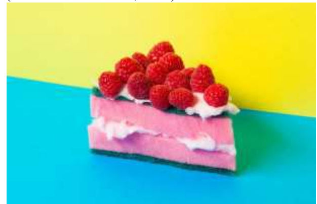
شكل (18) لوحة من سلسلة (اقتراحات تقديم) للفنانة باتريشيا توبين