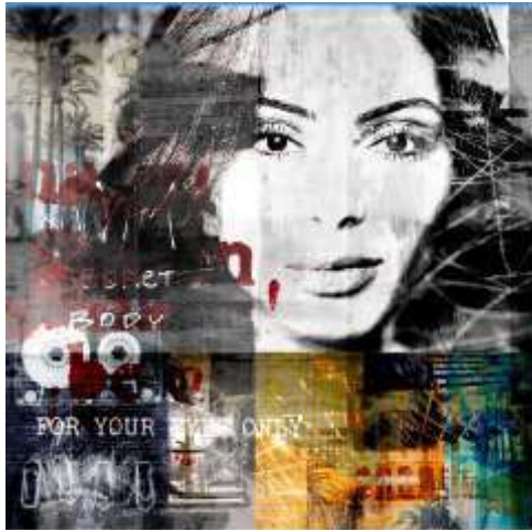
شكل (15) لوحة من سلسلة Diva للفنان سفن بيفرومر Sven Pfrommer

ومن أهم الفنانين المعاصرين الذين تأثروا أيضاً بفن البوب آرت هي الفنانة "الكسندرا كينجو Aleksandra Kingo" وكانت تقوم بمزج الموضة والبورترية جنباً إلى جنب مع الطبيعة الصامتة، وكانت "Kingo" تخلق أبعاداً جديدة تجبرنا على الدخول إلى عالم ملون يجد التوازن بين الجميل والمثير، وتستخدم "Kingo" اللون والموضوع بطريقة مثيرة للاهتمام تعكس اللمسة العصرية لفن البوب آرت، ونرى ذلك في شكل (16) وشكل (17) (Aleksandra Kingo, 2024)