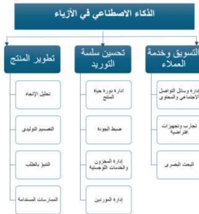
شكل (3) يوضح الذكاء الاصطناعي في تصميم الأزياء

والقابلية للتغيير السريع والتجديد لديه فهو يرتبط برغبته في سد احتياجاته وتجميل حياته لارتباطه بقضايا فكرية أو رمزية معقدة لا تمت له، وتؤكد فنه باستمرار تقاليد متوارثة، فهو لا يرتبط بتغيير المثاليات والأفكار. (عبد الغفار، 2003)