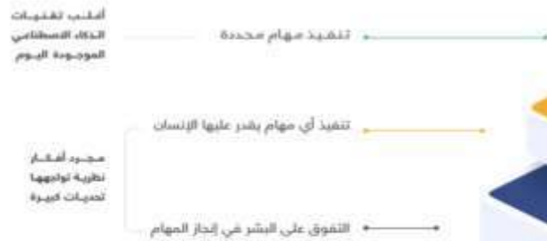
شكل (1) قدرات الذكاء الاصطناعي (SDAIA 2022)

3- التصميم التعاوني collaborative design : هو استخدام الذكاء الاصطناعي لتسهيل التعاون بين المصممين وأصحاب أولاً: بالنسبة لما يتمتع به من قدرات ينقسم إلى ثلاثة مستويات: