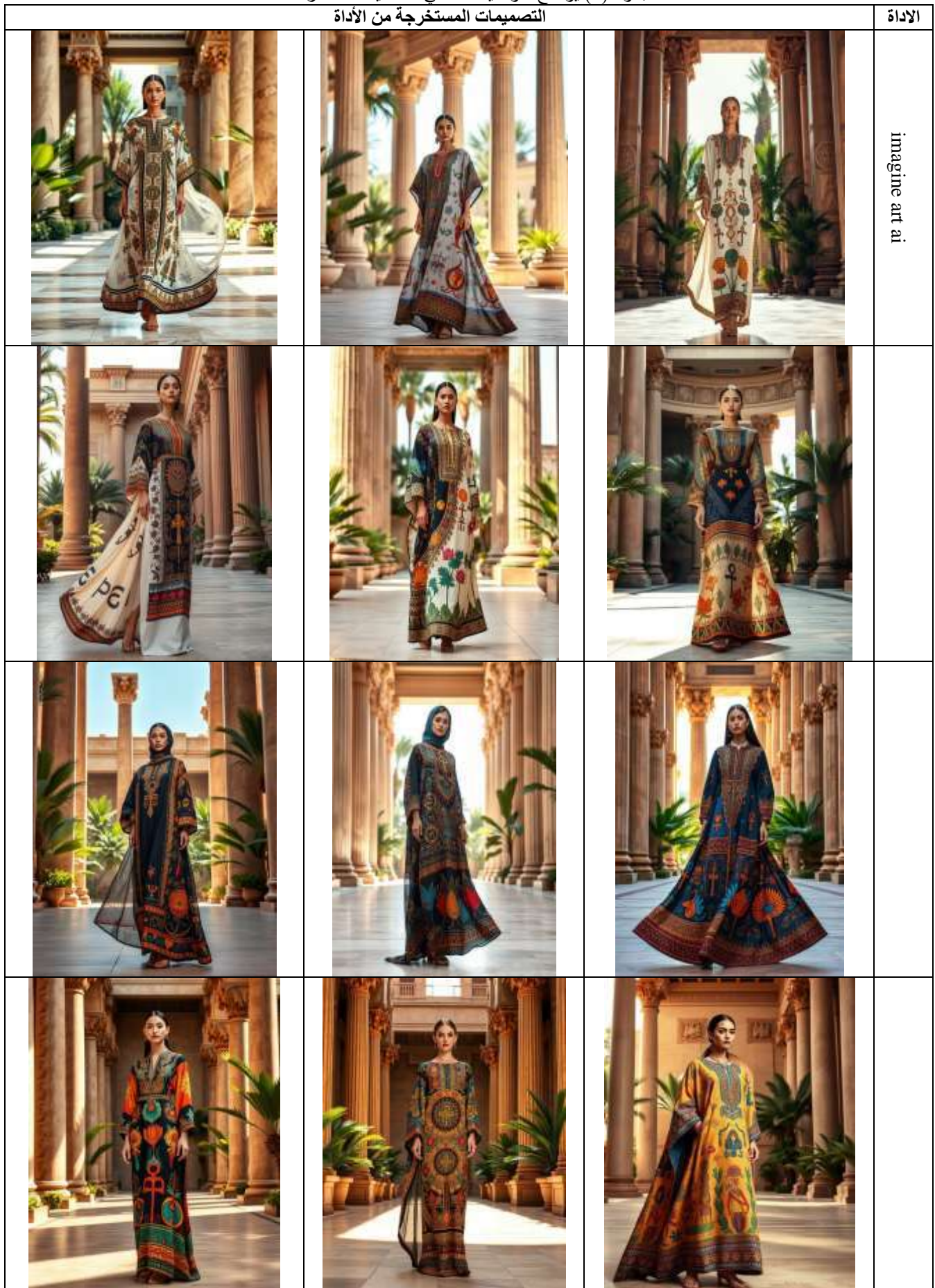
جدول (1) يوضح التوصيف النصي للتصميمات المقترحة التصميمات المستخرجة من الأداة