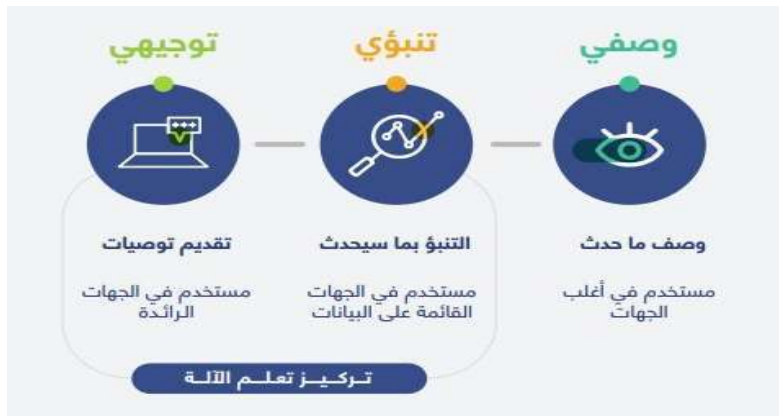
شكل (2) مستويات تحليل البيانات (SDAIA 2022)

المصممين في إنشاء تصميمات متعددة، وبذلك لا بد من التعرف على تطبيقات الذكاء الاصطناعي، وفعاليتها في إثراء الخيال الإبداعي في التصميم، والتركيز على دور الذكاء الاصطناعي الإيجابي في توفير حلول تصميمية. (العريفي 2023م) يندرج ضمن مجال الذكاء الاصطناعي عدد من التقنيات، ومن أبرزها في الوقت الحاضر يمكن تقسيم تقنيات الذكاء الاصطناعي بوجه عام إلى: