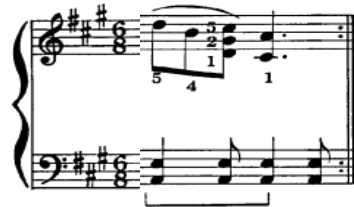
شكل رقم (٧) يوضح نغمات مزدوجة و تآلفات هارمونية ثلاثية متطلبات الأداء