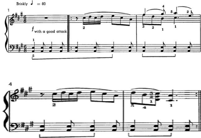
شكل رقم (١) يوضح القسم الأول من مقطوعة Country Fair م : ١ م : ٥