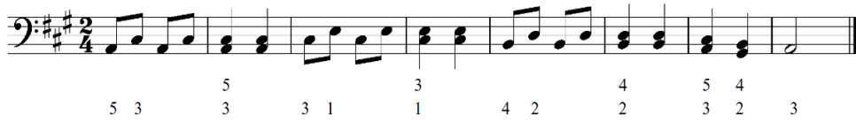
شكل رقم (٩) يوضح تمرين مقترح لأداء نغمات مزدوجة في اليد اليسرى