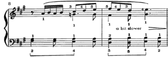
شكل رقم (٢) يوضح القسم الثاني من مقطوعة Country Fair م٦ : ٩

القسم الثالث : ٢(A) هو إعادة لحنية للقسم الأول