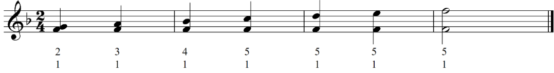
شكل رقم (١٨) يوضح تمرين مقترح للتدريب على أداء مسافات مختلفة بإستخدام النغمات المزدوجة لليد اليمنى