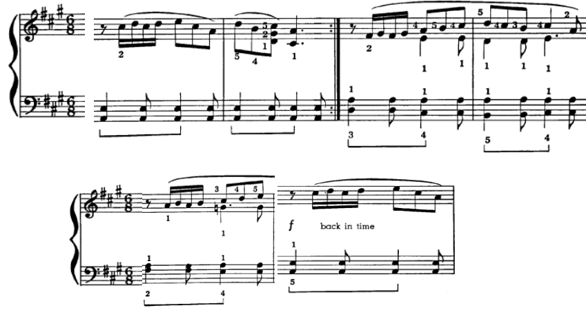
شكل رقم (١٢) يوضح مقطوعة Country Fair موازير رقم (م٤، م٥، م٦، م٧، م٨، م١٠)