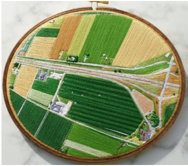
شكل (9) عمل فني لفكتوريا روز ريتشاردز

VICTORIA ROSE RICHARDS فيكتوريا روز ريتشاردز :- تتميز أعمالها بأنها خرائط للريف والحقول لأنها تتمتع بالجمال الطبيعي ، ويرجع اهتمامها بالطبيعة نظرا لأنها تعيش في مكان محيطة بالحقول والغابات المورقة والأنهار ، فهي تستخدم مزيجًا من الغرز على قماش اللباد لتقوم بأعمال مستوحاة من ريف ديفونيا ، وتقوم بإعادة إنشاء الحقول بالون زاهية ، وقد طلبت فيكتوريا من الأشخاص إرسال صور المناظر الطبيعية الجوية أو الأعمال الفنية المرتبطة بهم حتى تعيد إنشائها في سلسلة من الأعمال كما في شكل (9) ، وهناك أعمال تقوم بها كما في شكل (10) مستوحى من فيلم وثائقي شاهدته عن الجفاف حيث قامت في العمل بإظهار الأنهار مع دمج القمح وبذر الكتان ورشهم مع بعض ، مع وضع نبات الخشخاش لتصبح ألوان التصميم متناسقة.