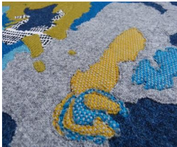
شكل (4) جزء تفصيلي للعمل الفني