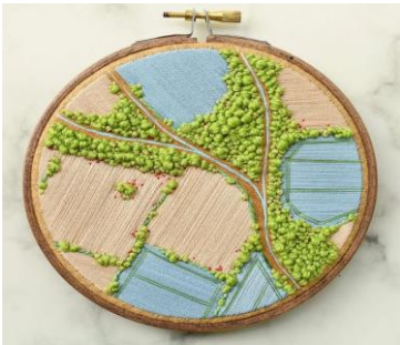
شكل (10) عمل فني لفكتوريا روز ريتشاردز