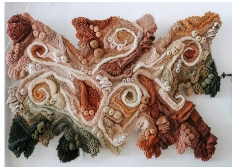
شكل (7) عمل فني لفانيسا باراجو

VANESSA BARRAGÃO فانيسا باراجو :- فنانة نسج تشتهر بسجادها ومفروشاتها وتصاميم الخرائط الشهيرة التي تشبه الشعاب المرجانية ، تهدف في أعمالها الفنية لحماية البيئة والتأثير على تغييرات السلوك الفردي التي من شأنها تحسين حالة الأرض والتي تحافظ على مظهر الشعاب المرجانية للفت الانتباه إلى الخطر الذي تتعرض له هذه الشعاب نتيجة تلوث المحيطات ، تصنع قطعها باستخدام خيوط الغزل التي تأتي من النفايات أو المواد الميئة من المصانع ثم تصنع الصوف يدويًا والمفروشات الحرفية والسجاد باستخدام تقنيات النسج المصنوعة يدويًا، وهي تجمع بين الكروشيه والنسيج والحاكاة والتلييد ، وهي تصنع قطعها يدويًا، منسوجاتها ثلاثية الأبعاد تشبه القوام العضوي والطبيعة الملموسة والطبقات المذهلة من فنها المحيط والشعاب المرجانية ، مما يجعلها تلتقط بشكل مثالي جمال الحياة البحرية ، كما في شكل (7) ، (8).