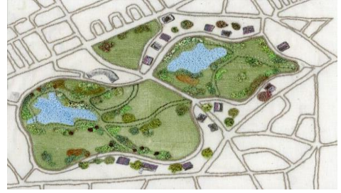
شكل (6) عمل فني لماري بريننج