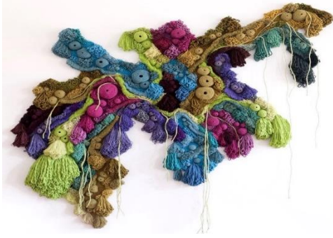
شكل (8) عمل فني لفانيسا باراجو