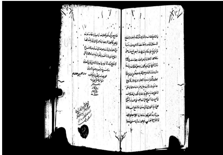
صورة للوح رقم (١٧)