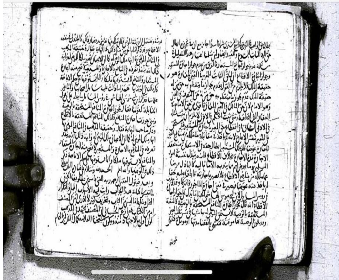
بداية التعقب من الورقة اليسرى في آخر (٦) أسطر من اللوح رقم (٧٥) من نسخة (ت).