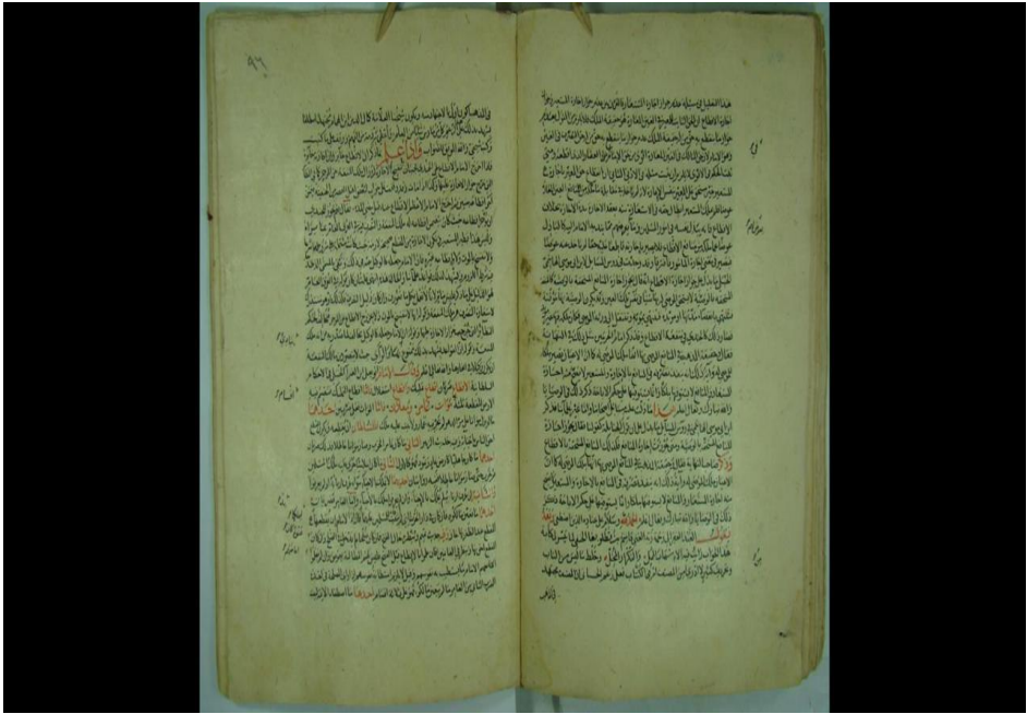
بداية التعقب من الورقة اليمنى في آخر (٤) أسطر من اللوح رقم (٩٦) من نسخة (ع).