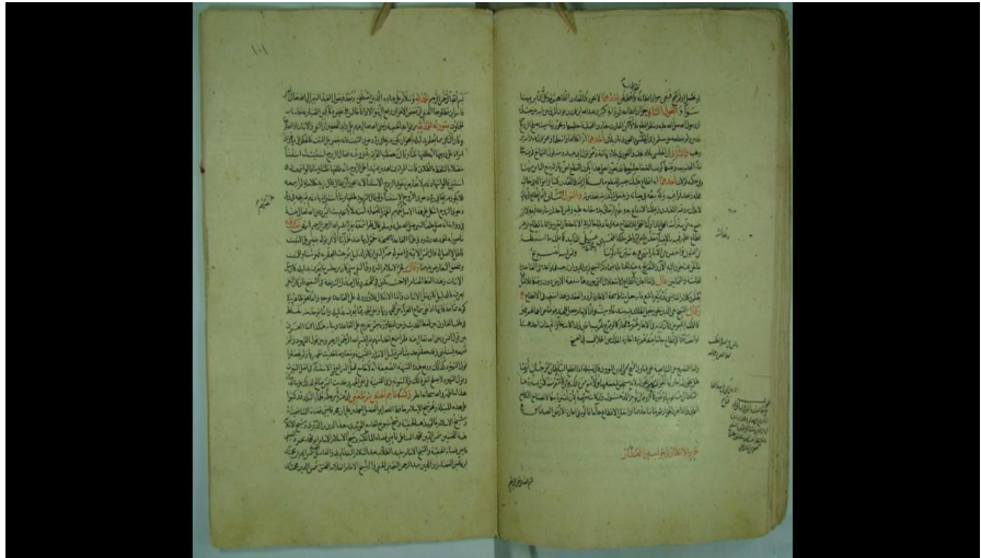
نهاية التعقب من الورقة اليمنى من اللوح رقم (١٠١) من نسخة (ع).