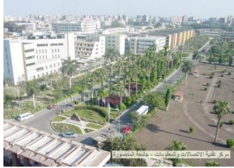
شكل (11) حديقة جامعة المنصورة