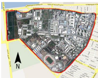
شكل (12) الموقع العام لجامعة المنصورة