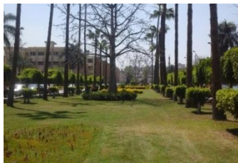
شكل (13) زراعة الساحات الخارجية بمسطحات خضراء واشجار