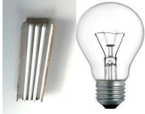
شكل (15) انواع وحدات الانارة المستخدمة في انارة مباني الجامعة