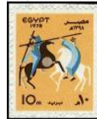
شكل (36) رقصة التحطيب على الحصان- فترة السبعينات

ففي السبعينات سجل تصميم طابع بريد نموذج لرقصة التحطيب على الحصان شكل (36) وهي رقصة شعبية معروفة ، وفي الثمانينات ظهر تصميم يشتمل على وحدة عروسة المولد بالألوان الشعبية المعروفة ومحاطة بالزخارف شكل (37)