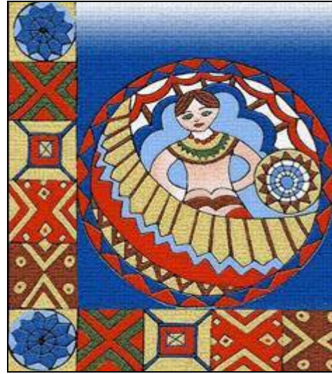
شكل (48) تصميم رقم (8)