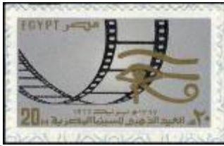
شكل (38) - العيد الذهبي للسينما المصرية- فترة السبعينات

وفي تصميم دار الأوبرا من الثمانينات شكل (39) وضع مبنى الأوبرا المعاصر داخل إطار من الزخارف الإسلامية وفي التسعينات شكل (40) استخدم إطار يمثل مدخل المعبد في الفن المصري .