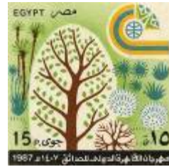
شكل (34) - طابع مهرجان القاهرة الدولي للحدائق - فترة الثمانينات

وقد عرف عدد لا بأس به من الفلاسفة الاتصال الثقافي فيعظم عرفه بأنه عملية تفاعل بين ثقافات وحضارات متباينة من حيث درجة التقدم المادي وغير المادي، بينما عرفه آخر بأنه تفاعل بين حضارات مبني على عملية الأخذ والعطاء بالكثير من القيم والمعتقدات والأفكار فضلا عن الوسائل المادية والتقنية التي تكون أداة لاستعمالها الثقافية، إلا أننا نجد الفيلسوف "هيغل" عرف الاتصال الثقافي بأنه العلاقة التفاعلية بين مجتمع وآخر عبر وسائل الاتصال المختلفة حيث أن معايير الثقافة سواء كانت مادية أو غير مادية تنتقل من مجتمع إلى آخر ويكون الانتقال عبر وسائل اتصال عديدة ، ويطلق عليها وسائل الاحتكاك الثقافي التي عبرها تنتقل معالم الثقافة المادية وغير المادية من مجتمع لآخر . وتمثل طوابع البريد نموذج للاتصال الثقافي الفعال والتي من خلالها يتعرف الآخرون على ثقافة وحضارة مجتمع بعينه .