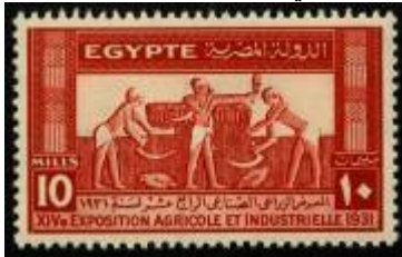
شكل (17) صورة الحصاد في الفن المصري القديم بطابع تذكاري

وقد استمر استخدام مناظر الآثار المصرية الفرعونية والقبطية والإسلامية طوال فترة الأربعينات والخمسينات والستينات بصورة مكثفة وحتى وقتنا الحالي.