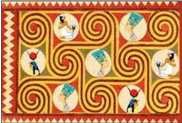
شكل (46) تصميم رقم (6)

المساحات في التكوين بصورة جديدة. وجاءت الألوان متماشية مع الفن المصري القديم فاللون البني يرمز لطمى النيل، والأزرق يرمز لزرقه المياه أو زرقه السماء المقدسة، والأحمر يمثل لون الدم الحى، أما الأصفر فيرمز لرمال الصحراء وأشعة الشمس الذهبية.