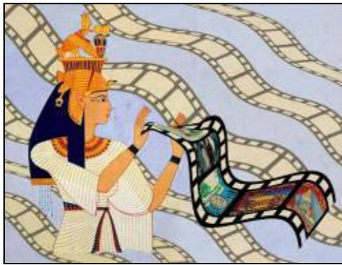
شكل 42 (أ، ب) تصميم رقم (2)