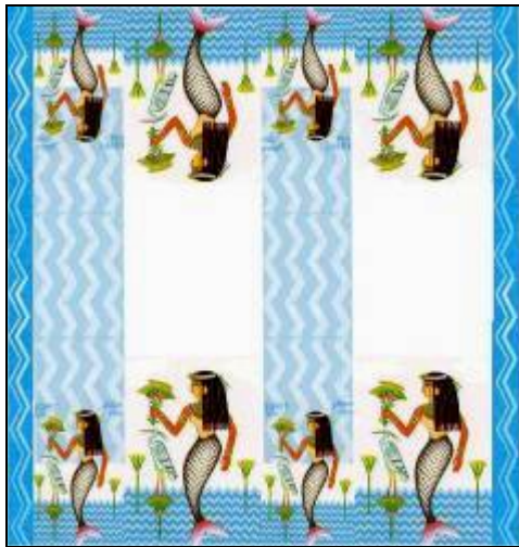
شكل (47) تصميم رقم (7)

العنصر الرئيسي في التصميم هو عروس النيل الفرعونية واستخدمت خلفية من خطوط الزجراج رمز الماء في مصر القديمة وكان للجمع بين خطوط الزجراج في الاتجاهين الأفقى والراسي اثر في إحداث الاتزان في تصميم المفروش، واللون الغالب في التصميم هو الأزرق المصري والذي يرمز لزرقه المياه أو زرقه السماء المقدسة.