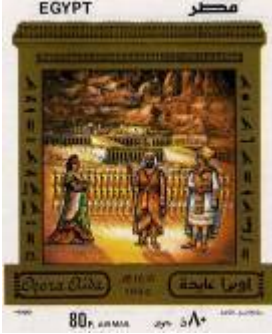
شكل (40) تصميم دار الأوبرا - فترة التسعينات