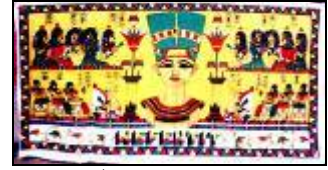
شكل (1) منتج سياحي مطبوع (معلق)

مصممة سعودية بتصميم قماش مطبوع من تراكب طوابع البريد شكل (7)