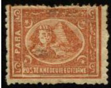
شكل (10) طابع بريد موثق بتاريخ 1874م