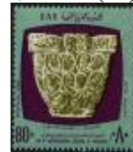
شكل (22) تاج عمود قبطي

ويلاحظ تطور التصميم المرسوم على الطوابع التي تطبع فيها تحف أثرية بحيث يتم رسم القطعة الأثرية ثم يرسم باقي الطابع بأجزاء من نفس القطعة الأثرية أو بأشكال زخرفية أخرى من نفس الفن المستخدم والأشكال (20، 21) توضح ذلك .