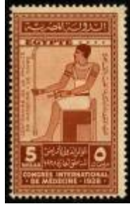
شكل (16) صورة اله الطب بالفن المصري القديم

ثم صدرت تباعا طوابع تذكارية لمؤتمرات عدة منها مؤتمرات الإحصاء والطب والسكك الحديدية (أمين ص 65) وكانت السمة الرئيسية في التصميم المطبوع فيها هي استخدام التحف الأثرية بحيث يتماشى موضوع المؤتمر مع القطعة الأثرية، كما في الطابع الصادر بمناسبة المؤتمر الدولي لأمراض المناطق الحارة وكان به رسم للمعبود بتاح ويقال انه يحتمب الذي تم تأليهه في العصر المتأخر وتوحيده مع اله الطب عند الإغريق (إبراهيم 2009 ص 287)، وقد رسم جالسا ويمسك بيده اليمنى الصولجان وفي يده اليسرى مفتاح النيل (شكل 16) وصدر هذا الطابع عام 1928 م.