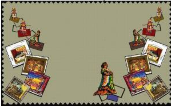
شكل (43) تصميم رقم (3)

يقوم البناء التشكيلي للتصميم على التكرار المتعاقب غير المنتظم باتجاه راسي في كلا الجانبين مؤكدا على حركة الخط المنكسر، واستمد التصميم عناصره من طوابع البريد الخاصة باحتفالات الأوبرا المصرية ، وقد استخدم أربعة طوابع للبريد كل طابع يعبر عن شكل مختلف لاحتفالات الأوبرا، واستخدم تنظيم المربع بحيث يتحرك في اتجاهات مختلفة ويتركب بعضها فوق بعض، وفي نفس الوقت يؤكد على حركة الخط المنكسر. الذي ينتهي من أعلى بتدرج في المساحة لشخصيات من الأوبرا تقف على مجموعة متراكبة من إطارات طوابع البريد.