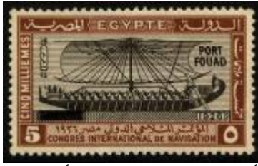
شكل (15) أحد مراكب الشمس باللون الأسود والإطار باللون الأحمر

ثم صدرت تباعا طوابع تذكارية لمؤتمرات عدة منها مؤتمرات الإحصاء والطب والسكك الحديدية (أمين ص 65) وكانت السمة الرئيسية في التصميم المطبوع فيها هي استخدام التحف الأثرية بحيث يتماشى موضوع المؤتمر مع القطعة الأثرية، كما في الطابع الصادر بمناسبة المؤتمر الدولي لأمراض المناطق الحارة وكان به رسم للمعبود بتاح ويقال انه يحتمب الذي تم تأليهه في العصر المتأخر وتوحيده مع اله الطب عند الإغريق (إبراهيم 2009 ص 287)، وقد رسم جالسا ويمسك بيده اليمنى الصولجان وفي يده اليسرى مفتاح النيل (شكل 16) وصدر هذا الطابع عام 1928 م.