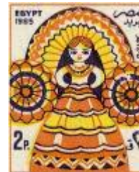
شكل (37) عروسة المولد بالألوان الشعبية - فترة السبعينات

وتنوعت أيضا العناصر التي تمثل الفنون الأدائية في تصميمات طوابع البريد بين التراث والمعاصرة ففي تصميم العيد الذهبي للسينما المصرية شكل (38) في فترة السبعينات جمع التصميم بين عين حورس من الفن المصري القديم والشريط السينمائي .