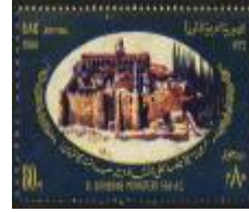
شكل (19) دير سانت كاترين

ب- التحف الفنية المطبوعة على الطوابع التذكارية :