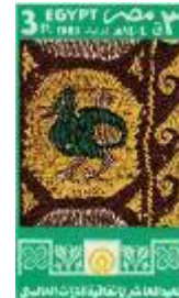
شكل (35) طابع من فنون النسيج في الفن القبطي - فترة الثمانينات

كما تطورت تصميمات طابع البريد التي تسجل التعريف بالفنون المختلفة من حيث القيم الجمالية والتشكيلية ففي تصميم طابع البريد المستوحى من الفن القبطي في فترة الثمانينات تم تكبير الوحدة الرئيسية شكل (35) بحيث تغطي المساحة الكلية للتصميم كنوع من السيادة في التصميم .