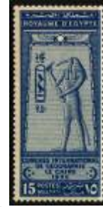
شكل (14) صورة اله فرعوني