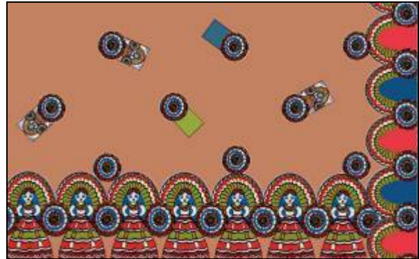
شكل (49) تصميم رقم (9)

اعتمد هذا التصميم أيضا على وحدة عروسة المولد بالألوان الشعبية المعروفة وذلك من خلال وضعها في جزء من أجزاء التصميم مع وجود أجزاء أخرى في باقي المساحة فيسود الجزء الخاص بالعروسة سيادة بصرية تتحقق بالانعزال المكاني . كما يقوم البناء التشكيلي على التكرار في الاتجاه الأفقي والرأسي مما أحدث إيقاعا حركيا في التصميم . واستخدمت الألوان في صورة مصممة دون تظليل من غامق إلى فاتح لتعطي ثقل للوحدات فوق الأرضية.