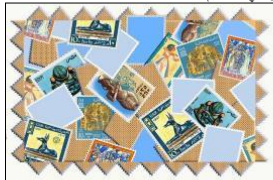
شكل (41) تصميم رقم (1)

اعتمد التصميم في بنائه على توزيع طوابع البريد باتجاهات ومساحات متباينة بحيث تتركب بعضها فوق بعض مما أعطى الإحساس بالعمق ، وتنتج عن التنوع في المساحات والاتجاهات ملمس ذو إيقاع حركي . ولتنظيم العلاقات بين الأجزاء من خط ومساحة وملمس إلى جانب توزيع درجات الفاتح والغامق أثر في تحقيق الاتزان ، كما أن اللون الأبيض أضاف اضاءات على أجزاء مميزة في التصميم.