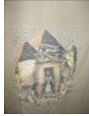
شكل (2) منتج سياحي مطبوع (تي شيرت)