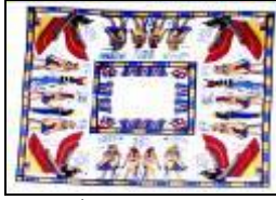
شكل (3) منتج سياحي مطبوع (مفرش) معروض بخان الخليلى بالقاهرة