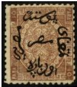
شكل (8) طابع بريد تمت طباعته عام 1866م

يعتبر التاج هو شارة الملك التي تخص أسرة محمد علي وقد ظهر التاج على الفنون والعمائر بمصر في القرن التاسع عشر الميلادي كتقليد انتقل من أوروبا إلى مصر وكان يعلو التاج الحرف الأول (أو الحرفين الأوليين) من اسم الملك باللغة الإنجليزية أو العربية ، أو قد يعلو التاج الهلال وبداخله نجمة خماسية واحدة أو ثلاثة نجوم- ( المحامى 2006 ص 709 ) إشارة إلى تولية الخديوي إسماعيل حكم مصر ( سالم 2009 ص 963 ) وكان ذلك من عام 1863 وحتى 1879م .