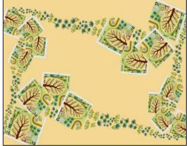
شكل (44) تصميم رقم (4)

استوحى هذا التصميم من طابع مهرجان القاهرة الدولى للحدائق والذي يشتمل تصميمه على عنصر شجرة الحياة مركز السيادة بالتصميم واحاطتها بأرضية غنية بالزخارف النباتية التى اتخذت بعضها شكل دائري وبعضها اتجاه راسي مع الاختلاف فى طول النباتات لتكون اقرب إلى البيئة الطبيعية. وتم تكرار تصميم الطابع بصورة متدرجة فى الاتجاهين الرأسي، والأفقى حيث الترتيب المتسلسل أو المتتابع، بمعنى أن العنصر تزداد أو تنقص إحدى خصائصه بانتظام في أحد الاتجاهات، ويعطى هذا النوع من التكرار التغيير مع الحركة والإيحاء بالعمق.