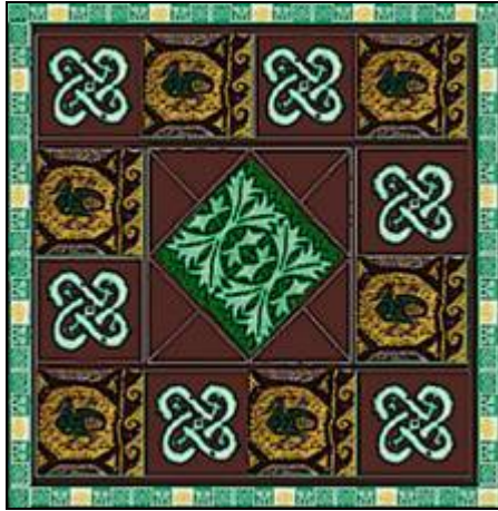
شكل (50) تصميم رقم (10)