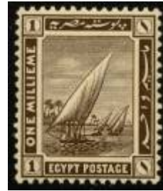
شكل (11) منظر النيل والمراكب

ويعتبر المؤتمر الجغرافي الدولي الذي أقيم في عام 1925 م من أوائل مجموعة الطوابع التذكارية التي طبع عليها عناصر من الفن المصري القديم، وقد تبعه طابع تذكاري بمناسبة مؤتمر الملاحة الدولي وكان في عام 1926 م يوضحه شكل (15) والذي رسم فيه أحد المراكب الفرعونية والمعروفة (بسفن الملاحة) ذات المجاديف التي ترجع إلى عام 1250 ق.م (شكري 1998)، وكان الطابع ملون بلونين اللون الأسود في مركب الشمس واللون الأحمر في الإطار المحيط بالشكل.