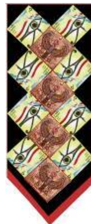
شكل (45) تصميم رقم (5)

يستمد هذا التصميم عناصره من مربعات منتظمة المساحة، ومنظمة في تتابع في اتجاه خط منكسر إلى اعلى، وتكرار المربعات بهذا النمط لم يفقد العمل ديناميكية بسبب التنوع في الأشكال الموجودة داخل المربعات، التي اشتملت على عين حورس، والطائر المجنح، وقد استخدم في تكرارها أسلوب التعاقب غير المنتظم في اتجاه منكسر. وقد تميز هذا التصميم باستخدام الاتجاه العكسي في توزيع العين، وقد ساهم عكس اتجاه الوحدة داخل المربعات في تحقيق التوازن في التصميم. وللعناصر الزخرفية المستخدمة أهمية خاصة لدى السائح فكان الاهتمام بتجميعها في عمل فى واحد.