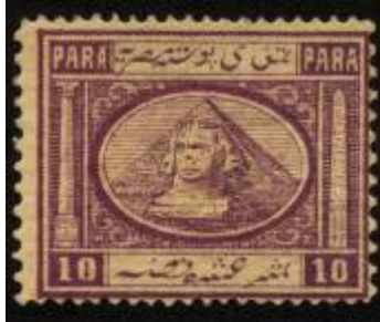
شكل (9) طابع بريد موثق بتاريخ 1867م