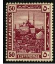
شكل (13) منظر لقلعة صلاح الدين