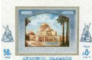
شكل (39) تصميم دار الأوبرا - فترة الثمانينات

وفي تصميم دار الأوبرا من الثمانينات شكل (39) وضع مبنى الأوبرا المعاصر داخل إطار من الزخارف الإسلامية وفي التسعينات شكل (40) استخدم إطار يمثل مدخل المعبد في الفن المصري .