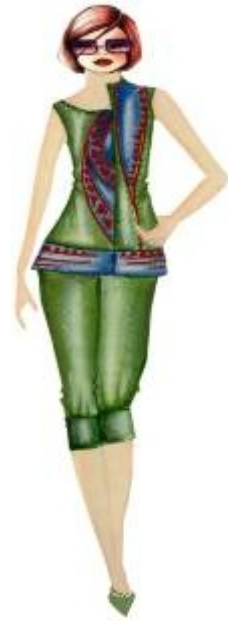
شكل " ٢٣ " بلوزة وبنطلون من تصميم الدراسة مستلهم من التراث النوبي

للتراث النوبي حيث الدائرة والمثلث في وحدات تتلائم مع موضة صيف ٢٠١٧ .