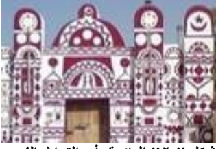
شكل "٢" الدائرة في التراث النوبي

طوافه حول الكعبة فالدائرة تعبر عن القدسية , كما هو موضح بالشكل "٣".