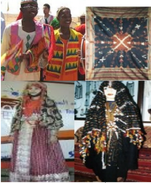
شكل " ١٥ " بعض الأزياء من التراث الشعبي النوبي ومصادرها من الحضارة الإسلامية القديمة " ابتسام محمد عبد الوهاب - ٢٠١٤ "

معينة . ويتوحد زي الرجال في أغلب المناسبات باستثناء الأعراس. أما بالنسبة للمرأة فتنوع ملابسها على حسب العمر والحالة الاجتماعية، فنجدها قبل الزواج ترتدي الجلابب مطرزا بالألوان الخفيفة والهادئة، حتى لا يكون لافتا للأنظار، وبعد الزواج ترتديه بتطريزات غنية وبألوان زاهية يغلب عليها الأحمر، الذي لا يسمح لها بإرتدائه قبل الزواج. أما الجلابب الذي ترتديه في المنزل فيكون من القطن وبلا تطريز، وترتدي المرأة «الجرجار» فوق الملابس. والجرجار بفتح الجيم عبارة عن ثوب محاك من قماش التل الأسود الرقيق، ومزين برسومات منمنمة بنفس اللون، أشهرها ورق العنب والهلل والنجمة قديما.