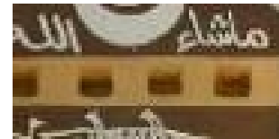
شكل "٢" المربع في التراث النوبي

١- المربع : يمثل المربع علاقات متوازنة حول نقطة المركز ، فنجد الكعبة "البيت المقدس " بنيت على أساس مربع فهو يمثل التوازن والقدسية , " وأستخدم لجلب الحظ , كما هو موضح بالشكل "٢".