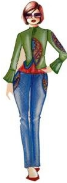
شكل " ٢٤ " جاكيت وبلوزه وبنطلون طويل من تصميم الدراسة مستلهم من التراث النوبي