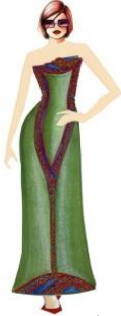
شكل " ٢٥ " فستان طويل من تصميم الدراسة مستلهم من التراث النوبي