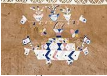
شكل "١٢" شكل السفينة في التراث النوبي

٣- السفينة : تمثل السفن مكانه خاصة لدى النوبيين ، ففي وصوله خير وبشرى لهم حيث كانت تحمل خطابات من النوبيين المهاجرين و الهدايا و المال ، كما استخدمت المراكب الشراعية في التنقل بين القرى النوبية الواقعة على جانبي النيل كما هو موضح في الشكل "١٢" .