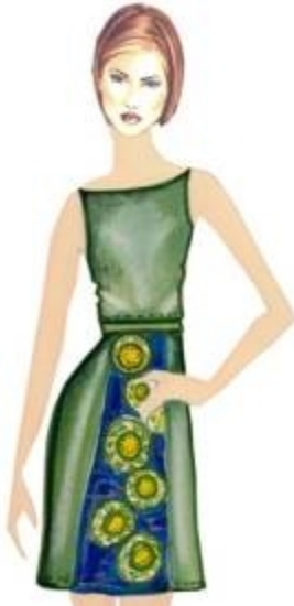
شكل " ٢٧ " فستان قصير من تصميم الدراسة مستلهم من التراث النوبي