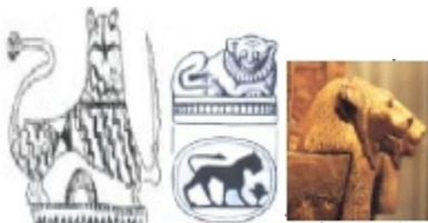
شكل "٦" الأسد في التراث النوبي

٢- الأسد : مصدره الأساسي من الطراز المصري القديم والحضارة الأشورية وهو رمز القوة والبسالة والإقدام والشجاعة وتم تناولة بعدة هيئات في الزخارف النوبية وكرسوم على الأثاث والأقمشة ومن المؤثرات التي أدت الى وجوده في التراث الشعبي النوبي هي البيئة الإجتماعية فقد عبرت القصص والسير الشعبية القديمة والتي تحكى عظمة وبسالة الأجداد بالأسد كرمز للشجاعة والإقدام والبطولة والقوة " ابتسام محمد عبد الوهاب - ٢٠١٤ " , كما هو في شكل "٦".