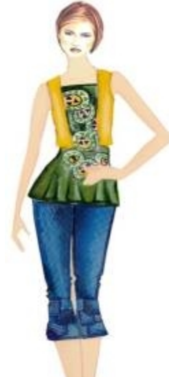
شكل " ٢٦ " فيست وبلوزه وبنطلون من تصميم الدراسة مستلهم من التراث النوبي