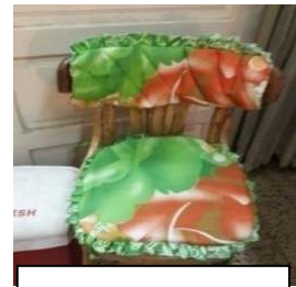
القطعة العاشرة:قاعدة و ظهر مبطن للكراسي الخشبية.