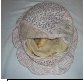
القطعة الثانيو عشر.حفاطة الحبز