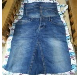
القطعة الحادية عشر: مريلة المطبخ.