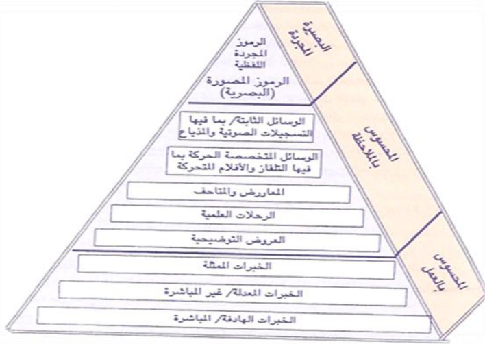
شكل رقم (١) : مخروط الخبرة (إدجار ديل) ، المصدر: (الجولاني ، ٢٠٠٨ م : ٢٤)