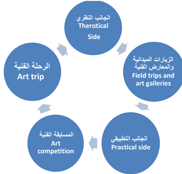
شكل ( ٢ ) المحاور الأساسية للبرنامج المقترح

يساعد هذا البرنامج علي التنمية الذاتية والتحفيز الداخلي لتقدير الفن وتمكين معلمي ومعلمات التربية الفنية من تجهيز أنفسهم بمهارات الفهم المتعمق من أجل طرح اساليب تدريس مختلفة وفكر جديد واستراتيجية تعليم تحول التربية الفنية الي مفهوم لتساهم في تحسين وتطوير عملية التعليم والتعلم وتطوير ثقافة وفكر المجتمع . ويتم تحديد محاور البرنامج ضمن خمس محاور اساسية المحاور الاساسية مرتبطة ببعضها البعض وهي كما في الشكل : (٢)