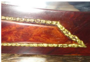
صورة رقم (٣٦) التركيب السيئ للنحاس من حيث عدم تساوي سمك الإطار