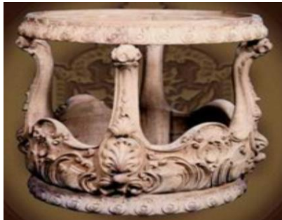
صورة رقم (٦) علي الرغم من أن هذه القطعة لا تنتمي لأي طراز واضح إلا أنها توحى بعدم الإستقرار (مرجع ١٧).

وفي هذه الحالة يحذف الصانع أشياء لخفض تكلفة المنتج وهذا غالبا ما يوجد في المنتج الشعبي أو المعروض للطبقة المتوسطة صور رقم (٥/ أ، ب)