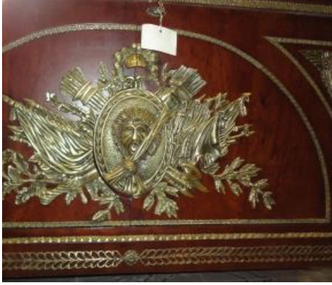
صورة رقم (١٩) تفاصيل الوجه للكمود السابق

نباتية، وأدوات حربية ، ويوجد بالمنتصف شكل وجه يصرخ وهو يمثل الثورة الفرنسية أما أجناب الكمود فزخارفه عبارة عن شكل ماركتري وشريط نحاس بالأعلى.