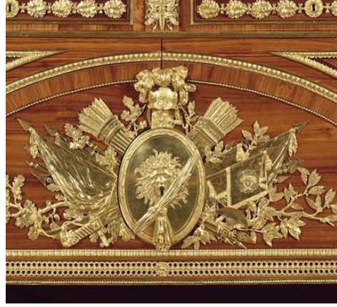
صورة رقم (١٨) تفاصيل توضيح وجه الكمود السابق وتظهر مدي دقة أعمال البرونز موجود بقصر الفونتين بلو (مرجع ١٦)

نباتية، وأدوات حربية ، ويوجد بالمنتصف شكل وجه يصرخ وهو يمثل الثورة الفرنسية أما أجناب الكمود فزخارفه عبارة عن شكل ماركتري وشريط نحاس بالأعلى.