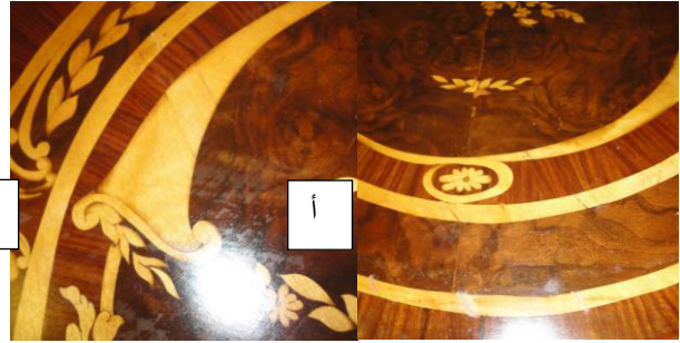
صورة رقم (٣٩/أ،ب) توضح الرسم الزيتي السيئ كما أن كل قطعة لا تشبه مثيلاتها.