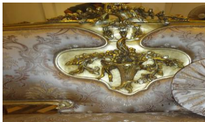
صورة رقم (١١) شكل باقة الورد في الظهر وفي الفرنتون