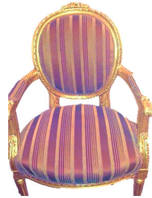
صورة رقم (٢٠) فوتيه كابورليه مصنوع بدمياط قام الصانع بإضافة فرننتون وزخارف ،في الظهر، والمانيلا،والمخدع(من تصوير الدارسة)

إضافة فرننتون لفوتيه لويس السادس عشر كابروليت ، وزخارف للمانيلا والمخدع ، وأسفل الظهر، صورة رقم (٢٠)توضح القطعة المصنوعة بدمياط ، صورة رقم