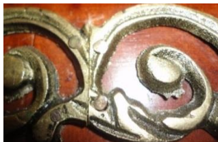
صورة رقم (٣٧) التركيب السيئ للنحاس من حيث تناسق الوصلات وعدم الإهتمام بتهديب الزوائد.