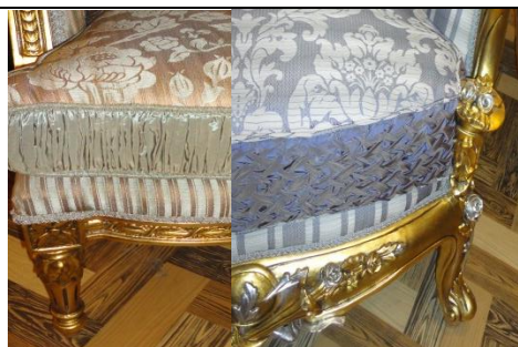
صورة رقم (٣٤/أ،ب،ج،د) طرق تنجيد مستحدثة بدمياط

(د - أ-٢) التشوه الذي يحدث أثناء تركيب الأكسسوارات ومكملات التصميم. في هذا الجانب من التشوه يتم تركيب مكملات التصميم له بطريقة غير لائقة للمجهود المبذول في القطعة صورة رقم (٣٥/أ،ب) (٣٦) (٣٧) فتركيب أي مسمار في غير مكانه يؤدي إلي إختلاف كبير في جودة المنتج النهائي. أمثلة علي التشوه بتركيب الإكسسوارات :