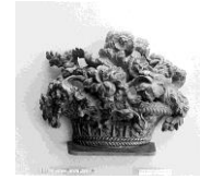
صورة رقم (٧) باقة الورد كجزء من شكلان كنصول بمتحف مترو بولتان (مرجع ١٥)