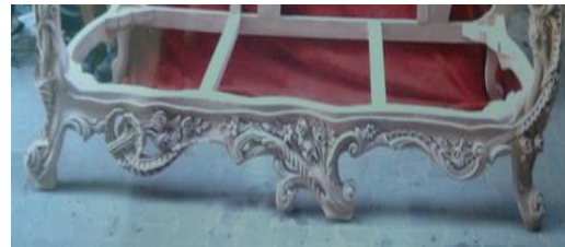
صورة رقم (١٠) تم حذف الرجلين في المنتصف وإضافة باقة الورد

في المنتصف وأضاف رجلين آخرين لا تشبه الرجلين في الأطراف ولا تمت لها بأى صلة فهذه تابعة لطراز إيطالي والأخرى لطراز فرنسي .