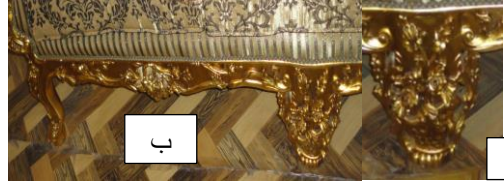
صورة رقم (٨/أ،ب) الرجل في المنتصف لا تشبه الارجل علي الاطراف تم حذف الرجل في المنتصف ثم إضافة رجل أخرى تشبه باقة الورد (من تصوير