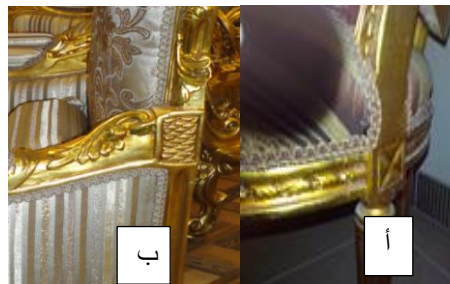
صورة رقم (٥/ أ، ب) حذف الروزته الأصلية وطمسها مكانها (من X بما يشبه قشر السمك أو وضع علامة تصوير الدارسة).