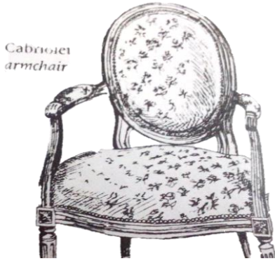
صورة رقم (٢١) الفوتيه الأصلي بسيط جدا ومجرد من أي زخارف . (مرجع ١٢ ص ٥٢)

(٢١) القطعة الأصلية. وذلك بسبب الخلط بين فوتيه كابروليت لويس السادس عشر وفوتيه لويس السادس عشر. ذا الظهر المسطح، والممتلئ بالزخارف.