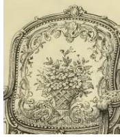
صورة رقم (٩) شكل باقة الورد في الجوبلان (مرجع ١٠)