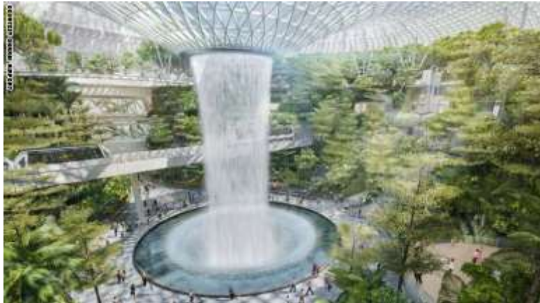
شكل (١٣) مطار "جوهرة شانغي" في سنغافورة و تظهر هنا الإستدامه و كفيته التكيف مع البيئه من خلال للطبيعه

فتحات التهويه و القباب التي تساعد على التهويه والحفاظ على الطاقه بالاضافه الى الناحيه الجماليه