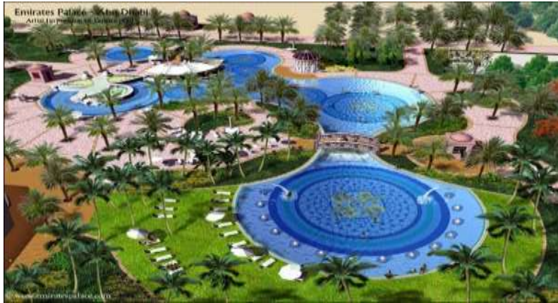
شكل (١A) قصر الامارات

انسيابيه في التصميم بحريه داخل هذه المساحات الهندسيه المختلفه مما جعل الفراغات متعايشه داخل المساحه و مترابطه في وحده عضويه نتجت عن جمال التصميم و الربط الجيد بين العناصر الموجوده في المكان مما جعله يبدو اكثر فخامه وجمالا .