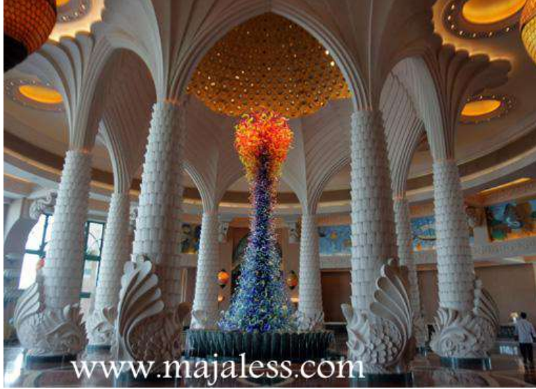
شكل (٧) فندق النخلة بدبي