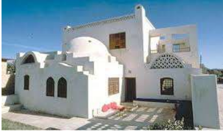
شكل (١١) طبقت الحضاره الاسلاميه معايير الاستدامه عن طريق استخدام ملاقف الهواء و الفراغات الداخليه للمساكن و القباب وذلك لبناء علاقه جيده مع الطبيعه من حيث التهويه و الطاقه