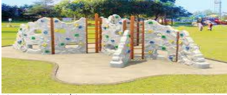
شكل (١) جزء معاجه من الفراغات الداخلية داخل الحديقة و هو مخصص للأطفال للعب و تفرغ الطاقات و هنا يظهر كيفية معالجه الفراغات