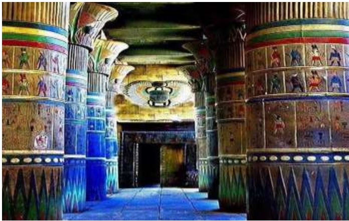
شكل (١٠) معبد الأقصر