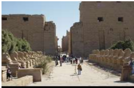
شكل (٢) يوضح كيف تعامل المصري القديم مع الفراغ و كيفية معالجته للتصميم بالخامات المستخرجه من الطبيعه و التي تتوافق معها مثل الاحجار و الاخشاب و الطين

تصميم مختصر لشكل النخله شكل (١A) من الاعلى و مستخدم في قلب حمام السباحه و هو تصميم مبتكر منفذ بخامه الموزييك مما اضفى على المكان جمال و روعه و جعله يتماشى مع اشكال النخيل المحيطة بالمكان مع ابتكار اشكال هندسيه تتماشى مع روح التصميم و اشكال مختلفه لحمام السباحه مما اضفى على المكان روعه في تصميم الاشكال الدائريه لحمام السباحه مما اعطى