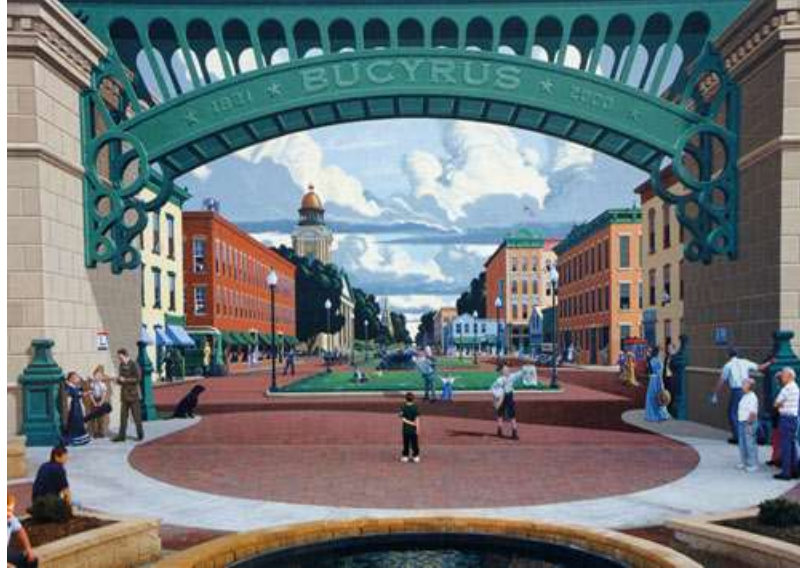
الشكل (٦) ولاية أوهايو ، الولايات المتحدة الأمريكية مفترق طرق بوسايروس ، أمريكا

تعيننا أن ندرك بها العلاقات الفراغية بين الأجزاء المختلفة التي يحتويها المنظر الطبيعي" (١٣: ص ٢٩٨) ونلاحظ أن اللون والضوء هما أداتان قويتان في خلق الإحساس بالفراغ إلا أن إحساسنا بالفراغ والعمق في المنظر الطبيعي يتأثر بالظواهر الخارجية الموجودة في الطبيعة ، فالألوان تفقد شدتها وحدتها في المسافات بسبب تزايد حجم طبقات الهواء