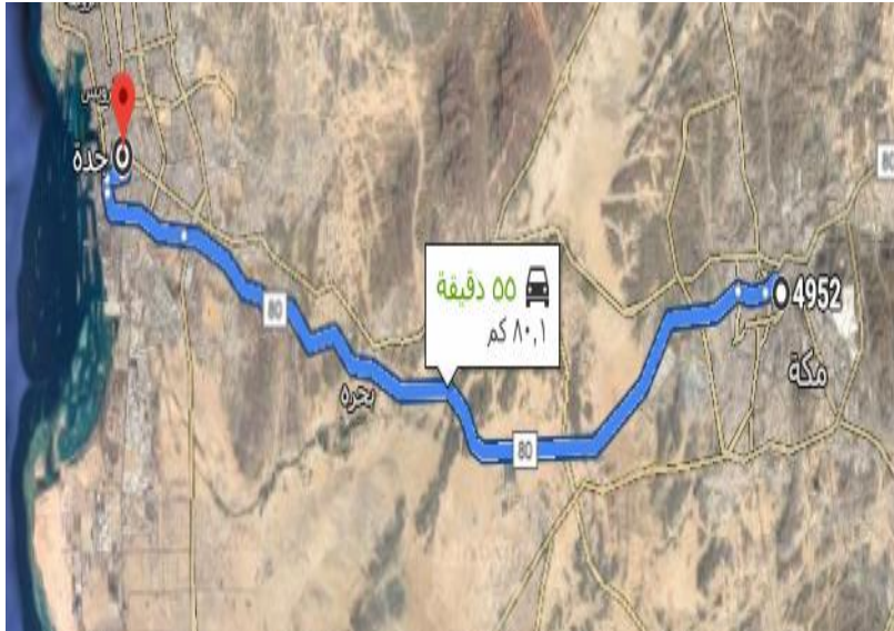
خريطة توضيح المسافة بين مكة وجدة