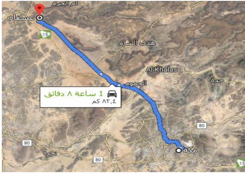
خريطة توضح المسافة بين مكة و عُسفان