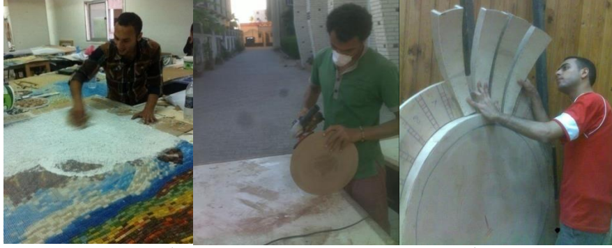
شكل رقم (٤) جانب من تنفيذ مشروع جداريه المسرح