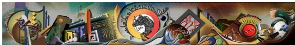
شكل رقم (١٠) احد الافكار التصميمية التي تم اعتمادها للتنفيذ في مشروع ٢٠١٤

٣- عرض الافكار : وهو هام جدا لبناء شخصية الطالب من خلال اظهار المعرفه التي حصل عليها فيما قبل التنفيذ.