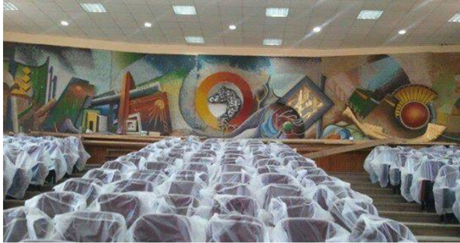
شكل رقم (١٥) مشروع ٢٠١٣ جدارية المسرح الكبير بالكلية