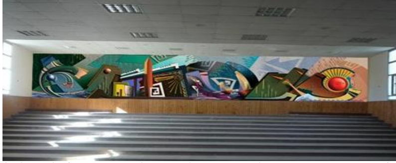
شكل رقم (١١) احد الافكار التصميمية بعد التركيب بالفوتوشوب داخل الموقع لعمل

٤- عرض نواتج تطبيق التصميم : وهو الرؤية المستقبلية للمشروع قبل بدايته.