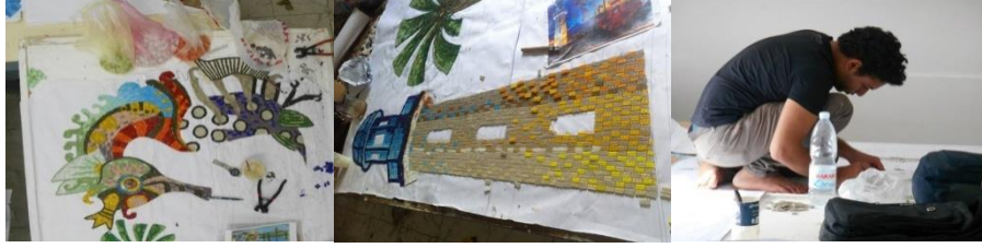
شكل رقم (٣) جانب من تنفيذ مشروع جداريه راس البر ٢٠١٤