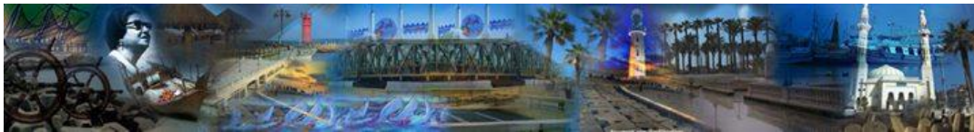
شكل رقم (٩) احد الافكار التصميمية من مشروع ٢٠١٤

٢- العرض التوضيحي / الشفهي : وهي مناقشة تدور حول المشروع وفحواه والغرض منه ويتم ذلك شفاهية امام لجنة المشروع.