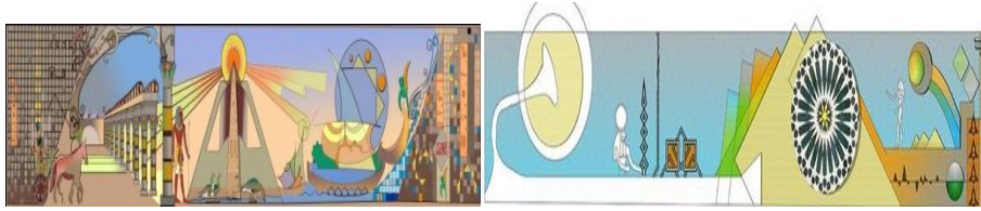
شكل رقم (٦) إسكتشات لفكرة تصميمية من مشروع ٢٠١٣