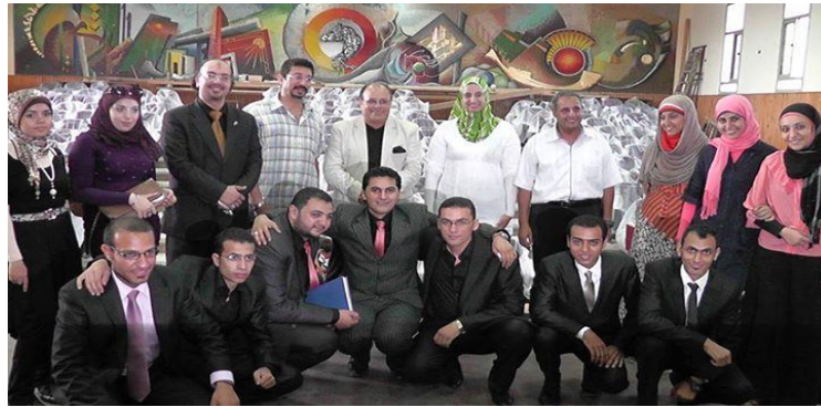
شكل رقم (١٢) اثناء تحكيم مشروع ٢٠١٣ في وجود اساتذة المشروع ولجنه التحكيم والطلبه

تاسعا: وبعد اجازة هذان المشروعان كان لابد من عمل بعض الدراسات والتحليل والتقويم والتقييم لادارة مثل هذه الاعمال وتقييمها :