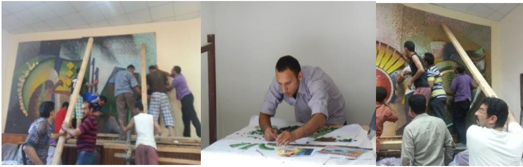
شكل رقم (١) توضح الصور مجموعه من المواقف الحياتيه التي تعامل من خلالها الطلاب وادت الى تطوير وبناء شخصياتهم فى مشروعى ٢٠١٣-٢٠١١

ويعرف الباحثان التصميم بانه تنظيم مبتكر لمجموع العناصر المستخدمة طبقاً لأسس معلومة وخطة بنائية تسمح بترباط واتزان العمل حتى ولو استدعى ذلك تعريفاً