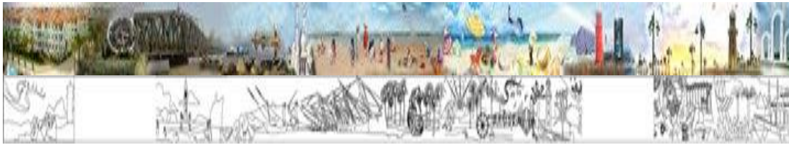
شكل رقم (٧) إسكتش تصميمي من مشروع ٢٠١٤