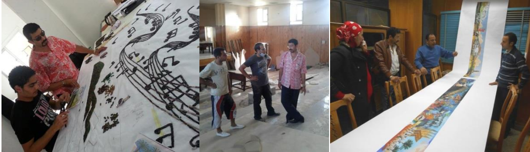
شكل رقم (٥) جانب من مناقشات بين الاساتذة والطلاب من تنفيذ مشروع الجداريات ٢٠١٣-٢٠١٤