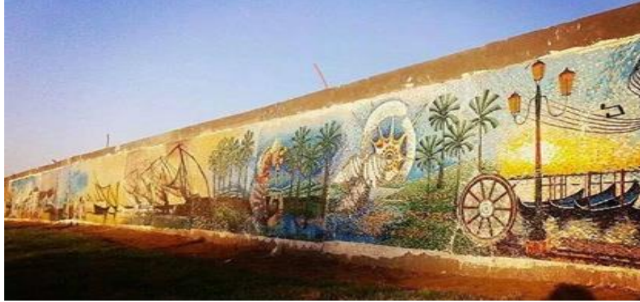
شكل رقم (١٦) مشروع ٢٠١٤ جدارية بانوراما راس البر بمدخل مدينة راس البر

خامسا / التقويم الذاتي : وهو مايقوم به الطلاب ذاتهم لتقييم اعمالهم برفقه اساتذتهم ممايتيح للطلاب التعود على النقد والتحليل والتقييم له ولزملاءوه.