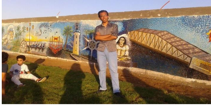
شكل رقم (١٣) اثناء تحكيم مشروع ٢٠١٤ جدارية بانوراما راس البر