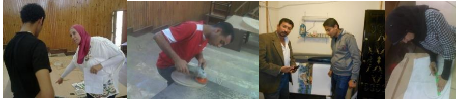
شكل رقم (٢) توضح الصور مجموعة من اللقطات للطلبة اثناء تدريبهم وتعلمهم من خلال الاحتكاك المباشر بالأساتذة وخبرات التعلم المختلفة مشروعي ٢٠١٣-٢٠١٤

صنع تعلمه من خلال قيامه بالعديد من الأنشطة التي يكتسب من خلالها المعلومة ، لذا أصبحت هناك حاجة مُلحة الى تطور أساليب التقييم لتشمل جميع جوانب الطالب ، المعرفية ، والمهارية ، والوجدانية للوقوف على جوانب القوة والضعف وتقويمها ، ومن هنا ظهر " مفهوم التقييم الشامل وهو " نظام يقوم جميع جوانب التعلم: المعرفية والمهارية والوجدانية لدى المتعلم "