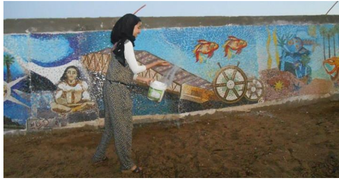
شكل رقم (١٤) اثناء تركيب مشروع ٢٠١٤ جدارية بانوراما راس البر