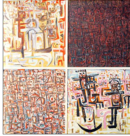
صورة رقم (١)