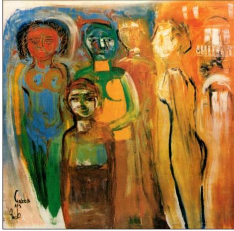
صورة رقم (٢)