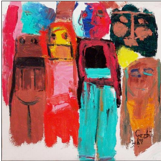
صورة رقم (٨) -٢٠١٣م-