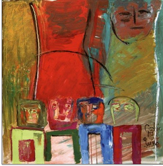
صورة (٦) -٢٠٠٩م- زيت على قماش- الأبعاد (٨٠ سم × ٨٠ سم).