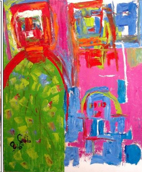
صورة رقم (٧) -٢٠٠٩م-