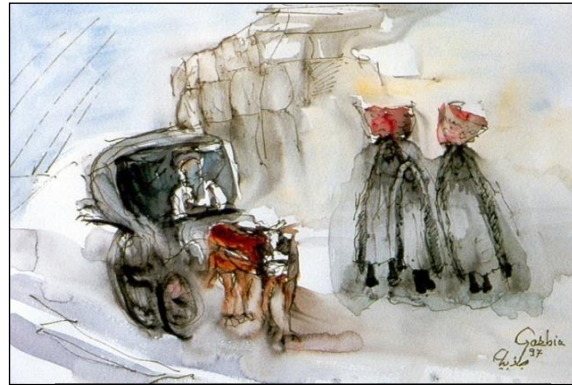
صورة رقم (٣)