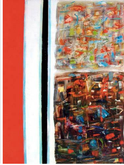
صورة (٥) -٢٠٠٣م- زيت على توال- الأبعاد (١١٦ سم × ٨٩ سم).