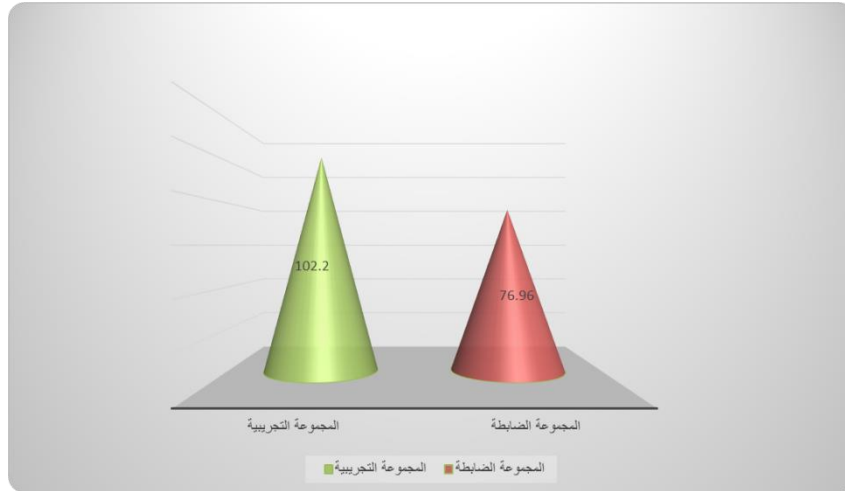
شكل (3) متوسطات درجات المجموعة التجريبية والمجموعة الضابطة في التطبيق البعدي لبطاقة ملاحظة الأداء المهاري المرتبطة بمهارات برمجة الروبوت التعليمي

يوضح الشكل الآتي متوسطات درجات المجموعة التجريبية والمجموعة الضابطة في التطبيق البعدي لبطاقة ملاحظة الأداء المهاري المرتبطة بمهارات برمجة الروبوت التعليمي: