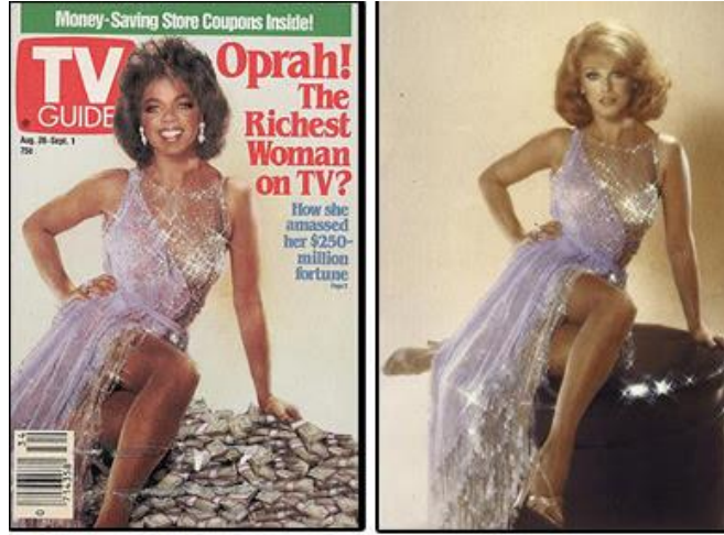
إلى اليمين الصورة الأصلية وإلى اليسار الغلاف المزيف صورة رقم (٣-٣)

وتطبيق حقيقي ففي ٢٥ أغسطس ١٩٨٩ نشرت مجلة TV Guide على غلافها صورة مفبركة لأوبرا وينفري، وهي تجلس عارية السيقان على كومة كبيرة من أوراق