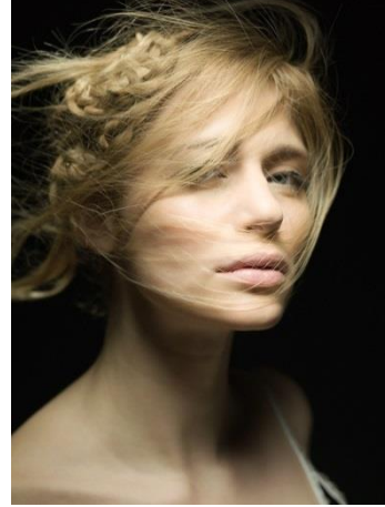
صورة رقم (٩) صورة شخصية

العديد من التعديلات على الصور حيث يتم هذا التعديل سواء بتغيير اللون أو تغيير الخلفية كما أنه في الإمكان إنشاء بعض التأثيرات على الصور و الكثير من التعديلات و التأثيرات التي يمكن القيام بها من خلال تلك البرامج ولكن photo shop يعد من أشهر تلك البرامج وذلك لما يتضمن من إمكانيات هائلة وسهولة في التعامل مع خروج الصور بشكل فني رائع ويمكن إضافة عنصر أو حذف عنصر من عناصر الصورة.