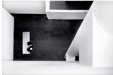
صورة رقم (٥) من اعلى مستوى النظر

- مستوى اسفل النظر low angle level: وهذه اللقطة عكس العلوية تماماً، حيث تكون الكاميرا في مستوى منخفض، وترفع العدسة لأعلى بزواوية ٤٥ درجة، وهذه تعطي انطبعا بالفخامة والتعظيم ، ولذلك فكل الصور الشخصية للرؤساء والزعماء تكون من هذه اللقطة. كما أثبتت الدراسات العلاقة بين زوايا الكاميرا ودلالات استخدامها في الصور الصحفية، فاختيار زاوية النقاط الصورة يحدد الانطباع الناجم لدى رؤيتها، وكذلك الدمج بين عمق الصورة وزاوية التصوير. (١٢)