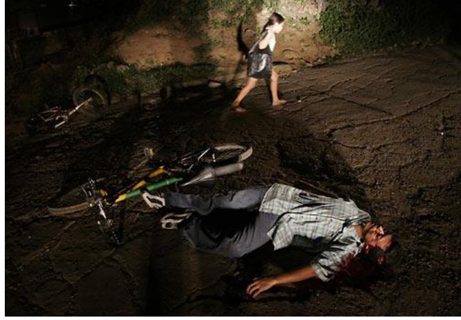
صورة رقم (٣-١) يوضح صورة تم تصويرها بعدسة قصيرة البعد البؤرى