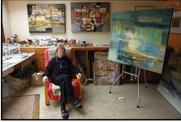
صورة رقم ( ١٠ ) لفنانة

عدسة تتميز بإعطاء مبالغة في المنظور كما أنها تظهر الأجسام القريبة بشكل كبير نسبياً عن البعيدة ومن عيوبها نقص في حدة جوانبها و يمكن علاجها بتضييق فتحة العدسة