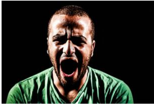
صورة رقم (١-٣)