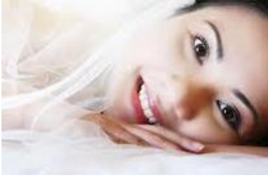
صورة رقم (٢-٢)

استخدام طبقة اضاءة منخفضة و طبقة اضاءة مرتفعة