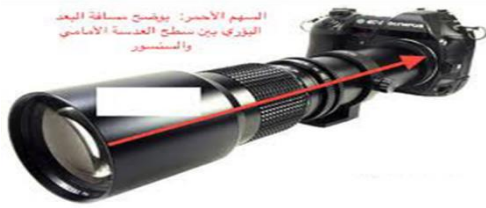
صورة رقم (٧) مسافة البعد البؤري وشكل العدسة طويلة البعد البؤري

تتميز هذه العدسات بأنها تعطي نسبة تكبير عالية وتحتل نسبة كبيرة من حيز الفيلم كما أنها تعطي تضاعف في المنظور نتيجة اقتراب المسافة بين الأجسام البعيدة والقريبة ويحدث نتيجة عن استخدام العدسة تشوه نتوي مما يسبب ان الصورة يحدث لها انبعاج للداخل نحو مركز الصورة. كما أنها تتسم بقلة عمق الميدان.