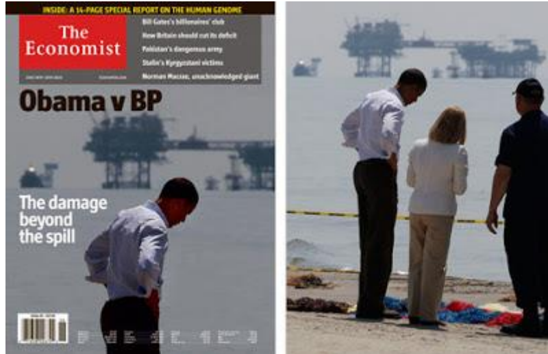
إلى اليمين الصورة الأصلية وإلى اليسار الغلاف المزيف صورة رقم ( ١١ )