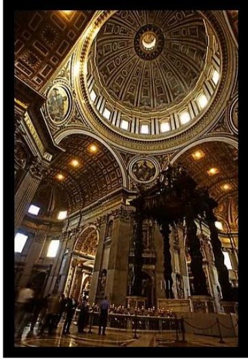
صورة رقم (٦) من اسفل مستوى النظر