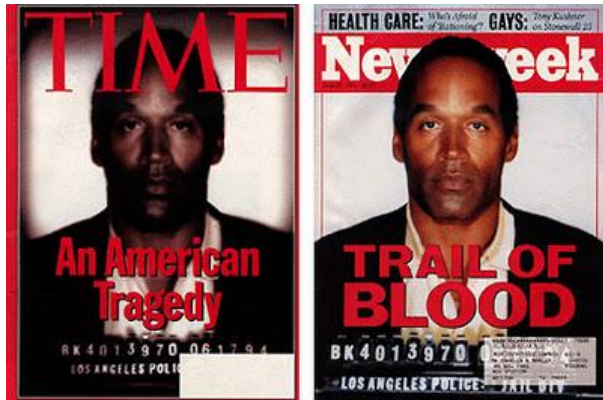
الضوء لغة الصورة .. الفارق كبير بين الغلافين صورة رقم (٤)

الضوء هام جدا فى عملية التصوير الضوء هو لغة الصورة الناطق بالمعنى الدلالى وذلك لانه يوجد طبقات للاضاءة وكل طبقة من طبقات الاضاءة لها مدلولها فيوجد طبقة الاضاءة العالية high key وهى تحتوى على اماكن ضوء كثيرة والظلال قليلة وهى توحى بالسعادة والفرح ومستوى الاضاءة المنخفضة Low key وهى تغلب عليها اماكن الظلال وهى توحى بالحزن والغموض والخوف .