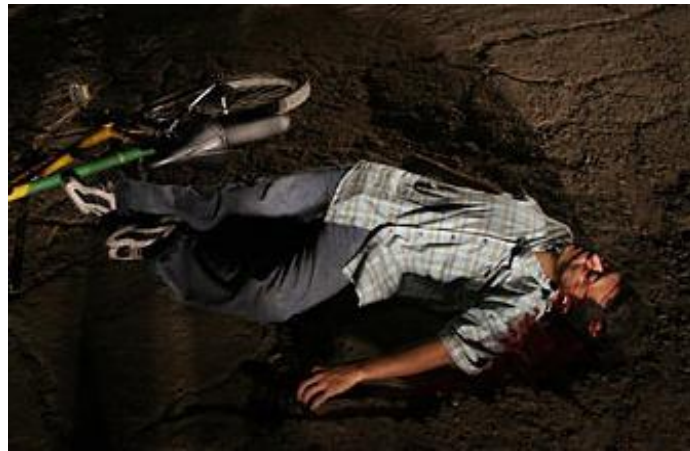
صورة رقم (٢-١) يوضح صورة تم تصويرها بعدسة متوسطة البعد اليوري