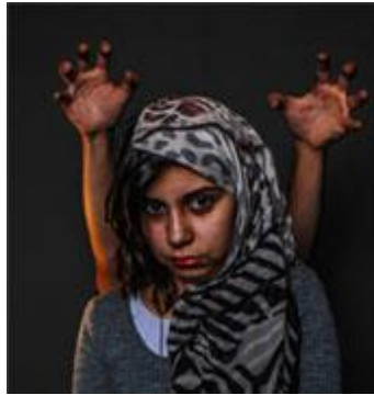
صورة رقم (٣)

صورة لها مدلول أن المسلمين والمسيحيين يدا واحدة