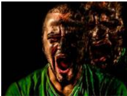
صورة رقم (٢-٣)

استخدام الحاسب لآلى فى التركيب والحذف والاضافة