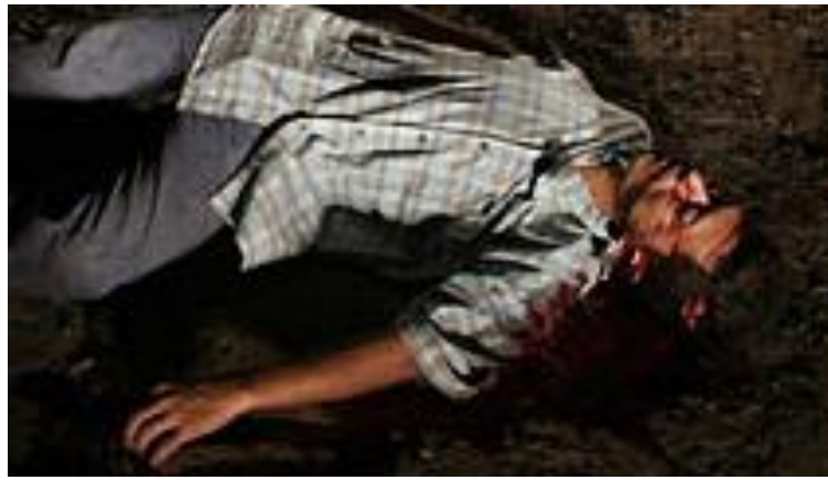
صورة رقم (١-١) يوضح صورة تم تصويرها بعدسة طويلة البعداليوري

١- التطبيق الأول اثر استخدام عدسات مختلفة مما يعطى معانى ودلالات مختلفة .