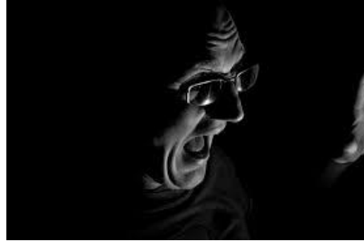
صورة رقم (١-٢)