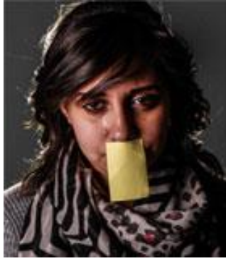
صورة رقم ( ٢ )

توحى الصورة بالمعاناة بالاجبار على الصمت