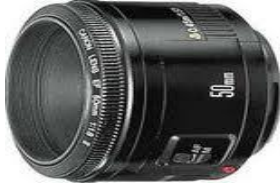
صورة رقم (٨) العدسات متوسطة البعد البؤري

وهي عدسات متوسطة في عمق الميدان فهي تعطي أحجام الأجسام والنسب والمنظور مماثل لعين الإنسان . ويوضح شكل التالي العدسات متوسطة البعد البؤري (١٣)