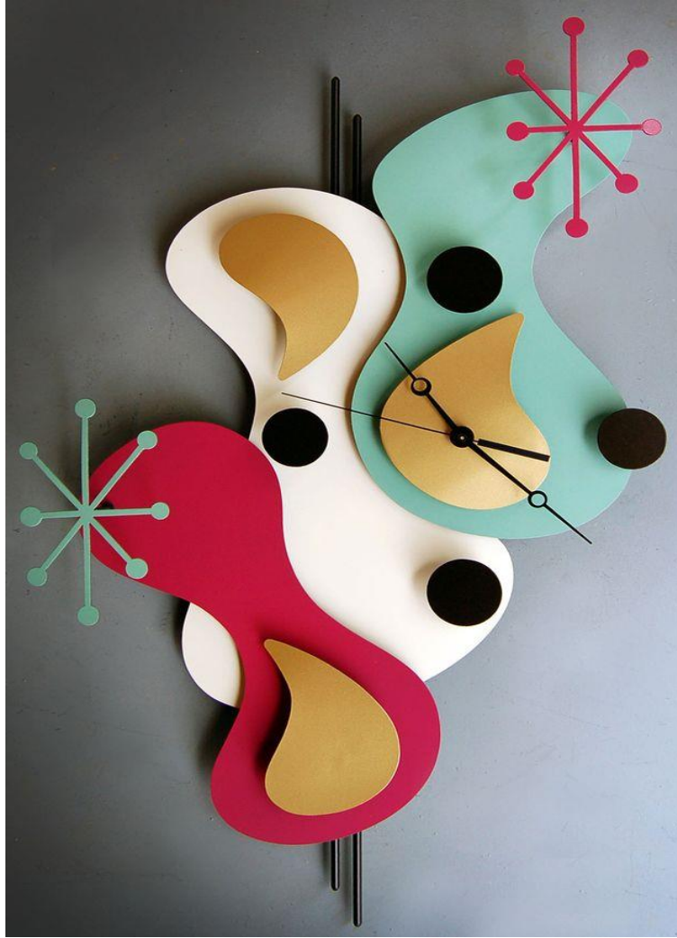
شكل (٧) معلقة ساعة حائط ، مستمدة من أعمال كاتدنيسكي ، خشب MDF ملون ، إسطوانات معدنية مطلية ، ٢٠١٤ .

ثقافة مجتمعية جديدة بأعمال المشاركين فيها ، ولكي تتكامل وتنصهر تصنيفات الفنون من الرسم والنحت والجغرافيا والعمارة في بوتقة واحدة في صورة أعمال تطبيقية ؛ منها أن كُسيبت واجهات العماثر والمحال التجارية بتصميماته ، كذلك عناصر التصميم الداخلي . كتب موندريان في أحد المقالات معبراً عن أسلوبه وفكره " أنا أبني تركيبات من خطوط وألوان على جسم مسطح للتعبير عن جمال عام. أو من أنه يمكن لأشكال الجمال الأولية هذه أن تصبح أعمالاً فنية ، تُركب عن وعي دون حسابات، بدافع من حس مرهف" (٧) . كما يوضح شكل (٨) عمل تصويري للفنان الهولندي موندريان التشكيلية الجديدة ، عام ١٩٢١ .