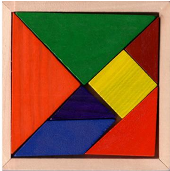
شكل (٤) منتج تطبيقي من الفكر التكعيبي ، لعبة أطفال ، أشكال هندسية مسطحة.

يمكن الاستفادة من فكر الاتجاه التكعيبي ، فى تصميم منتج تطبيقي (لعبة تركيب) للاطفال المعروفة بالتانجرام (١) شكل (٤) مكونة من أشكال هندسية مسطحة كالمربع ومتوازي المستطيلات والمثلث بأحجام متباينة ، ترتب وتجمع فتعطي أشكال طبيعية متنوعة شكل (٥) . تميز المنتج بالزهاء