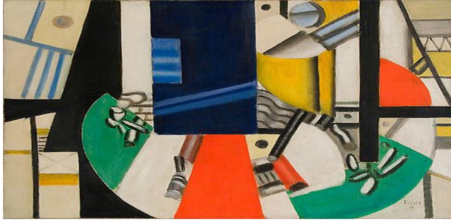
شكل (٣) من أعمال الفنان فرناند ليغيه ، يظهر أسلوبه التكعيبي ، تصوير زيت على توال ، ١٩٢٠ ، مجموعة خاصة.

اللونى وذلك باستخدام الالوان الاساسية لجذب انتباه الاطفال مع البساطة فى التكوين ، كما يمكن تطوير الشكل الظاهري لتلك اللعبة من خلال تجديد الالوان أو الخامة ... الخ لاكسابها مزيداً من التشويق والاثارة البصرية . المنتج من الاخشاب الطبيعية والدهانات الثابتة الغير سامة ويمكن تنفيذه يدوياً أو آلياً .