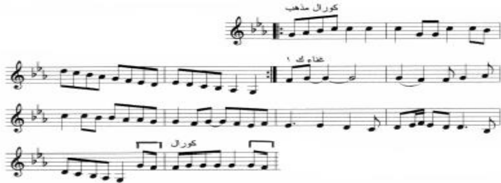
شكل رقم (٢) يوضح جزء من نوتة أغنية علي الربابة بغني (كمثال)

◀ تتناقش الباحثة مع الأطفال حول معاني ومفردات كلمات الأغنية الوطنية كذلك القيم الاجتماعية المستفادة منها.