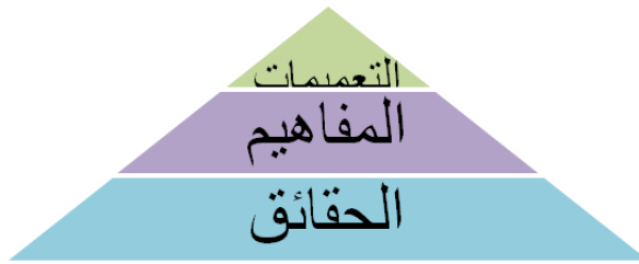
الشكل ( ٤ )