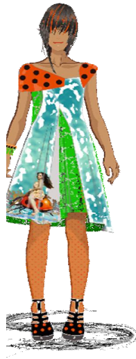
شكل رقم (12): التصميم الثاني

تصميم فستان غير متمائل بدون أكمام بحمالات غير متمائلة يتسع عند نهايته، قصير يصل طوله الى اعلي الركبة، الحمالة بالجانب الأيسر تكون من قطعة مغلقة باللون البرتقالي، منقطة بأسلوب غير منتظم بألوان لوحة الجرافيتي المستخدمة، اما الحمالة في الجانب الاخر فهي على شكل أشبه بالمثلث تسقط عن الكتف وهي بنفس لون الحشرة، اما البدن الأساسي للفستان الذي يكون يتسع من