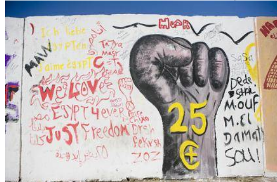
شكل رقم (1) اليد القوية- التحرير

نيويورك لتأكيد سيطرتهم علي أحد احياء المدينة. فترينت جدران الميادين الكبيرة برسوم الجرافيتي الملونة، وتؤكد مني اباطة انه من غير الواضح ما إذا كانت جداريات التحرير تمثل ثورة يناير اما انها مستلهمة من واجهات البيوت في القرى المصرية، وأساليب الزخرفة الإسلامية، والعناصر الزخرفية الفرعونية الممتزجة بالفنون المعاصرة، فكل هذه المواضيع تمتزج لتظهر لنا الجداريات في ميدان التحرير (Abaza, 2013).