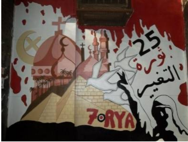
شكل رقم (21) لوحة الجرافيتي السادسة