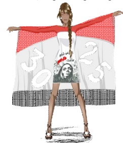
(اعلى) شكل رقم (15) التصميم المقترح الثالث