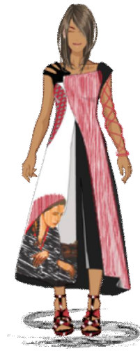
شكل رقم (9): التصميم الأول

تصميم لفستان غير متمائل بكم واحد على شكل شبك و حمالات غير متمائلة وواسع من الأسفل يصل طوله إلى اعلي الساق ، وهو من ثلاث قطع ، الحمالة في الجانب الأيسر تكون من قطعة مغلقة باللون الأسود يركب بها الكم المشبك من الخيوط باللون الفوشيا، اما الحمالة في الجانب الثاني فيها ثلاث شقوق وهي تمثل امتداد الجزء الذي يمثل البدن الأساسي للفستان به اتساع عند نهايته ويصل طوله الى نهاية الساق ومن خامة الجورجيت الأسود، إما القطعة الامامية من الفستان فتتكون من قطعتين تبدأ الأولى من الصدر من جانب اليسار تكون مثبتة مع بدن الفستان حتى خط الارداق والباقي حر بدون تثبيت، تزين هذه القطعة من خلال رسم خطوط طولية باليد باللون الفوشيا على جميع مساحة القطعة، ومن اسفلها القطعة الثانية في نقطة النقاء حمالة كتف من جهة اليمين بها قطع على شكل قوس الى الخارج باتجاه خط الوسط يمتد من تحت الإبط إلى بداية خط الارداق وهذه القصة مغطاة بقماش دانتيل باللون الفوشيا، اما القطعة الثانية فمن قماش ساتان ابيض مرسوم عليه الفتاة موضوع لوحة الجرافيتي.