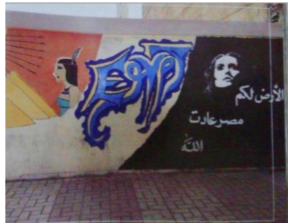
شكل رقم (14) لوحة الجرافيتي الثالثة

يستلهم التصميم لوحة رسم من جرافيتي الثورة المصرية، علي احد جدران إسكندرية، مصدر اللوحة صورة ضوئية من كتاب (ارض ارض- شريف عبد الحميد-2012). تقنيات تنفيذ اللوحة هي الرسم الحر بالفرشاة، وتقنية الاستنسل.