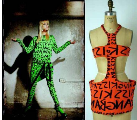
شكل رقم (5) بعض أزياء مجموعة المشرقة للمصمم ستيفن

تصميم الملابس عمل ابتكاري يتأثر بالعوامل بالأحداث السياسية والتغيرات الاجتماعية فضلا عن المؤثرات الثقافية والفنية، ومنها حركة الجرافيتي على مستوى العالم، يعتبر ستيفن سبروس Stephen Sprouse 1953-2004 من رواد مصممي الملابس في تطبيق اسلوب الجرافيتي، فقد أطلق مجموعته الاولى في ديسمبر 1983 باسم "Day-Glo" او المشرقة شكل رقم (5)، وغلب على خطوط التصميمات الألوان الباردة وهيئة الملابس الفضائية، كما ظهرت على تصميماته الكثير من الكتابات.