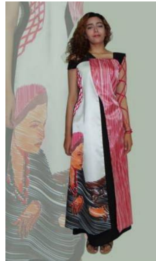
شكل رقم (10): التصميم الأول بعد التنفيذ

يستلهم التصميم لوحة للفنانة التشكيلية المصرية (حنان غانم) مصدرها الصفحة الشخصية للفنانة علي أحد مواقع التواصل الاجتماعي (facebook). يغلب في تنفيذها استخدام أسلوب الرسم المباشر بالفرشاة.