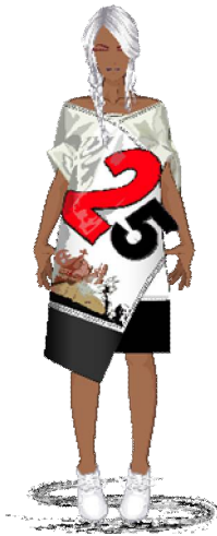
شكل رقم (22): التصميم المقترح السادس

توصيف اللوحة: رسم جرافيتي جداري من ميدان التحرير، نوفمبر 2013. تقنية تنفيذ اللوحة بالرسم الحر بالفرشاة، والحبر البخاخ Spray وكتابة الحروف والكلمات.