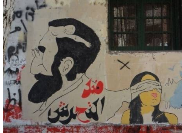
شكل رقم (19) لوحة الجرافيتي الخامسة

رسم جرافيتي جداري نفذ بعد الثورة (نوفمبر، 2013) علي أحد الجدران بميدان التحرير والفنان مجهول. تقنية تنفيذ اللوحة بالرسم الحر والحبر البخاخ Spray وكتابة الحروف والكلمات.