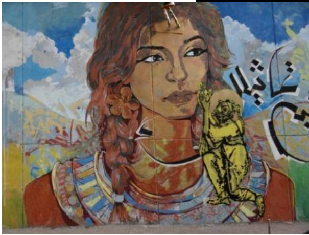
شكل رقم (17) لوحة الجرافيتي الرابعة

يستلهم التصميم الرابع لوحة جرافيتي جداري من ميدان التحرير، القاهرة تم التصوير يناير 2013. تقنية تنفيذ اللوحة هي بالرسم الحر والكولاج والحبر البخاخ Spray والكتابة بالحروف والكلمات.