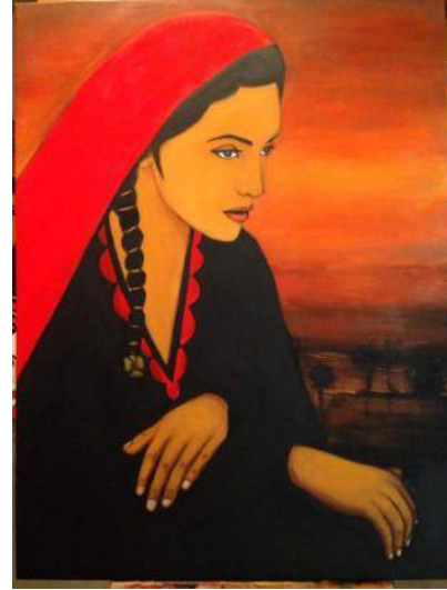
شكل رقم (8): لوحة الجرافيتي الاولى

يستلهم التصميم لوحة للفنانة التشكيلية المصرية (حنان غانم) مصدرها الصفحة الشخصية للفنانة علي أحد مواقع التواصل الاجتماعي (facebook). يغلب في تنفيذها استخدام أسلوب الرسم المباشر بالفرشاة.