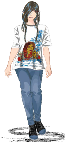
شكل رقم (18) التصميم المقترح الرابع

يستلهم التصميم الرابع لوحة جرافيتي جداري من ميدان التحرير، القاهرة تم التصوير يناير 2013. تقنية تنفيذ اللوحة هي بالرسم الحر والكولاج والحبر البخاخ Spray والكتابة بالحروف والكلمات.