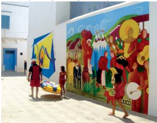
شكل رقم (4) أحد جدران مدينة أصيلة

اما في المغرب فتعد منطقة أصيلة، شكل رقم (4)، من أهم المناطق التي اهتمت بفنون التصوير الجداري وتشتهر أصيلة بجدرانها الملونة برسوم الجرافيتي (عبد الكبير الميناوي: 2009). وكان الرسم على الجدران في مدينة أصيلة وفقا على الفنانين المغاربة، قبل أن يلتحق بهم فنانون قدموا من مختلف قارات العالم لمشاركتهم، ونتيجة لهذا التجمع الكبير تحولت اصيلة الى متحف للفنون وخاصة الرسوم الجدارية (احمد سليم: 2013).