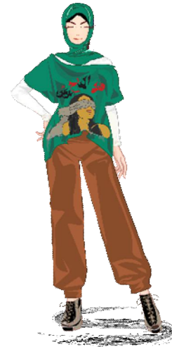
شكل رقم (20): التصميم المقترح الخامس

رسم جرافيتي جداري نفذ بعد الثورة (نوفمبر، 2013) علي أحد الجدران بميدان التحرير والفنان مجهول. تقنية تنفيذ اللوحة بالرسم الحر والحبر البخاخ Spray وكتابة الحروف والكلمات.