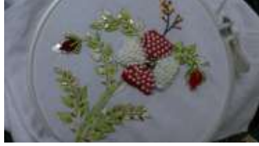
صورة (4) توضح التطريز الخرز

- الترتير : هو عبارة عن دوائر صغيرة أو أوراق أشجار مصنوعة من صفائح معدنية رقيقة أو بلاستيك شفاف ويكون الترتير ذهبيا وفضيا أو ملونا بألوان براقية متدرجة أو بألوان مضيئة غير لامعة . (29)