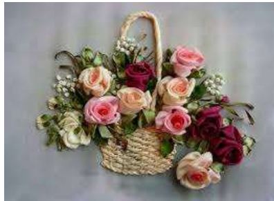
صورة (6) توضح التطريز بشرائط الستان

وهو أسلوب شيق بديع لفن التطريز يظهر فيه فن التوليف حيث يتم تنفيذ شرائط الستان على النسيج بغرز معينة ويظهر بالقطعة إيقاع وتجسيم نتج من ارتفاع ملمس الشرائط المطرزة بها عن مستوى الارضية وبها تنوع فى الملامس والالوان مما يعطى انسجام ووحدة عضوية وإحساس جديد ومختلف عن التوليف بالتطريز بالاساليب التقليدية . (4)