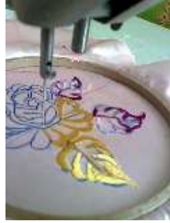
صورة (6) توضح التطريز الآلي

أمثلة لبعض أنواع الغرز التي تطرز آلياً بدون طارة التطريز: غرزة القطان، غرزة السلسلة، الأجر، الزجاج. (30)