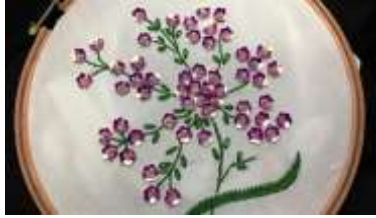
صورة (5) توضح التطريز الترتير

- الترتير : هو عبارة عن دوائر صغيرة أو أوراق أشجار مصنوعة من صفائح معدنية رقيقة أو بلاستيك شفاف ويكون الترتير ذهبيا وفضيا أو ملونا بألوان براقية متدرجة أو بألوان مضيئة غير لامعة . (29)