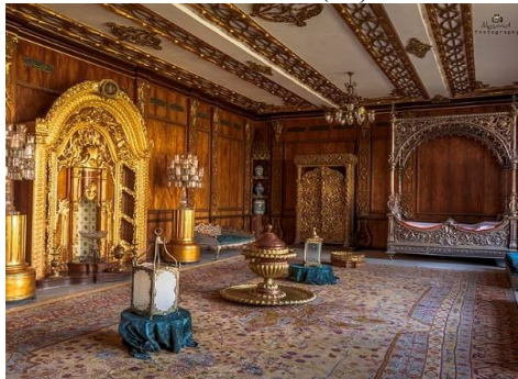
صورة (18) توضح حجرة النوم بالقاعة الشتوية