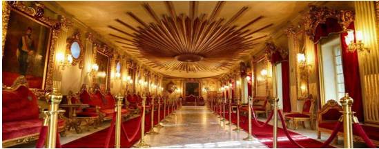
صورة (17) توضح قاعة الوصاية