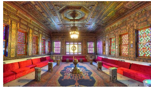
صورة (14) توضح القاعة الشامية بسراي الاستقبال