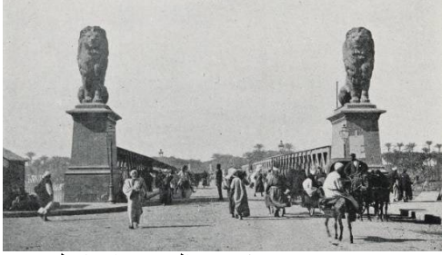
صورة (6) توضح كوبري الخديوي إسماعيل

حكام مصر ( https://www.almaany.com/ ). وكانت القاهرة عند تولي "الخديوي إسماعيل" عرش مصر تمتد من منطقة القلعة بسفح المقطم شرقاً وتنتهي حدودها الغربية عند مدافن الأزبكية وميدان العتبة والمناصرة التي يفصلها عن النيل مجموعة من البرك والمستنقعات والمقابر والتلال، وعمد الخديوي إسماعيل إلى صنع ثورة عمرانية بالقاهرة وتحويلها إلى قطعة من أوروبا لتكون "باريس الشرق" (سهير حواس، 2002، ص14-15).