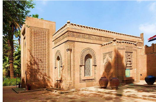
صورة (20) توضح المسجد

شيد المسجد على الطراز العثماني ويعتبر من المنشآت المتميزة معمارياً وفنياً، ورغم صغر مساحة المسجد الذي يتوسط القصر إلا أنه يعد تحفة معمارية وزخرفية لا مثيل لها . فقد اعطى الأمير محمد علي له عناية خاصة سواء من الخارج أو الداخل، فمن الخارج زين سطح المسجد بعرائس من الحجر الرملي على شكل رؤوس حيات (الكوبرا) أسفلها شريط من الكتابة القرآنية لسورة الفتح، أما الجدران فقد زخرفت على هيئة سجاجيد من طرز مختلفة والنوافذ على شكل عقود محاطة بأشرطة من الزخارف الهندسية، وللمسجد كتلة مدخل مستطيلة الشكل وتعلو سطحه كما أنها تبرز عن المبنى وهي زاخرة بأنواع كثيرة من الزخارف صورة (20).