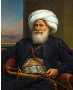
صورة (4) توضح محمد علي باشا مؤسس الأسرة العلوية

يعتبر محمد علي باشا هو رأس الأسرة العلوية في مصر التي استمرت في حكم مصر (1805-1952م) صورة (4) ، ومؤسس مصر الحديثة، فقد انتقل بمصر من ظلام العصور الوسطى الذي سيطر عليها خلال ثلاثة قرون من الجهل والضعف والتخلف تحت حكم العثمانيين إلي مشارف العصر الحديث ودفعها إلي مستوي الدول القوية والمتقدمة، فقد أدرك محمد علي باشا بفطرته العبقريّة رغم أميته وعدم إلمامه بالقراءة والكتابة أن الارتقاء بالبلاد لا بد وأن يتركز علي تعليم شعوبها، وأن الحدائث ومواكبة التطور يعني إحياء العلوم والآداب وإعداد العلماء في كل المجالات (سهير حواس، 2002، ص8).