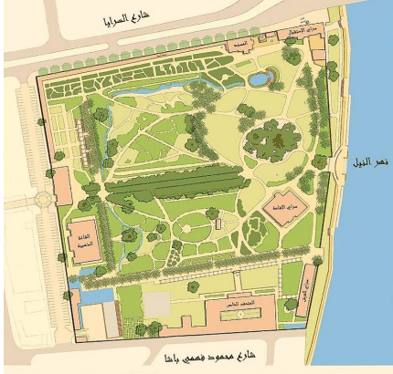
صورة (10) توضح موقع القصر

يقع القصر على ضفاف نهر النيل الشرقي بجزيرة منيل الروضة في مواجهة القصر العيني يقع قصر الأمير محمد علي (شارع السرايا بالمنيل)، وتبلغ المساحة الكلية للقصر حوالي 61711 متر 2 وتمثل مساحة المباني بما فيها السرايات منها 5000 متر 2 ، وباقي المساحة خصصت للحدائق والطرق الداخلية صورة (10).