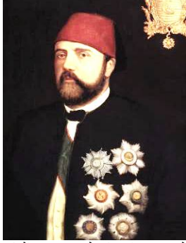
صورة (7) للخديوي إسماعيل مؤسس القاهرة الخديوية

وقد شهدت القاهرة في عهد الخديوي إسماعيل دون شك تطوراً مهماً ونقلة نوعية لم تعرفها من قبل وتضاعفت مساحتها وضمت أحياء عمرانية ذات مواصفات جديدة (أيمن فؤاد، 2015، ص406)، وبلغت مساحة القاهرة الخديوية في مخطط الخديوي إسماعيل 2000 فدان أي أنها تضاعفت 4 أمثال مساحتها الأصلية فقد بلغ تعداد سكان القاهرة الخديوية 350 ألف نسمة بدلاً من 270 ألف نسمة فوضع التخطيط لاستيعاب 750 ألف نسمة تستقبلها القاهرة الحديثة على مدي 50 سنة، وكان هذا يعني انخفاض الكثافة السكانية إلى حوالي 50% مما كانت عليه (سهير حواس، 2002، ص21).