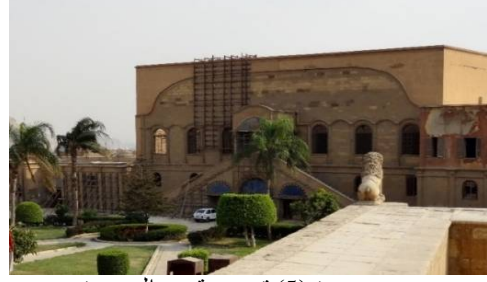
صورة (5) توضح قصر الجوهرة

والتصنيع والانفتاح على الغرب، فعمل علي تبادل الثقافة بيناء دار للبعثات المصرية في باريس قدمت عشرات من الخبراء المصريين في مختلف العلوم والفنون فكانوا نواة النهضة الثقافية والتعليمية في مصر التي أنشأ لها مختلف المعاهد والمدارس والمصانع في أنحاء البلاد (توفيق عبد الجواد، ص316-317). وقد اشتهرت "قاهرة محمد علي باشا" بالقصور الرائعة التي شارك في بنائها مجموعة من الفنانين والمتخصصين والعمال المهرة من فرنسا وإيطاليا وأيضاً تركيا، وكان شرط عملهم هو تعيين أربعة من المصريين لكل فنان أو خبير أجنبي يعملون معهم ويتعلمون منهم المهنة، ومن أشهر قصور تلك الفترة قصر الجوهرة، وقصر القبة صورة (5)، وقصر الحرم، وقصر الأزبكية، وقصر شبرا، وقصر النيل، ... إلخ (سهير حواس، 2002، ص9).