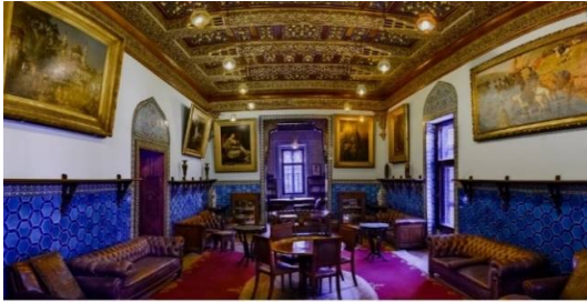
صورة (16) الصالون الأزرق بسراي الإقامة