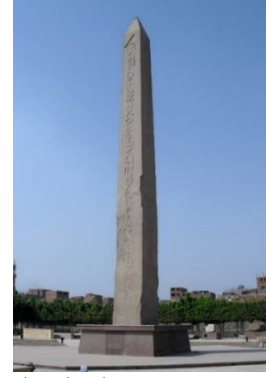
صورة (1) توضح مسلة هليوبوليس

آثار معابد ومكتبات للفلسفة وعلوم الفلك والرياضيات (ويكيبيديا).