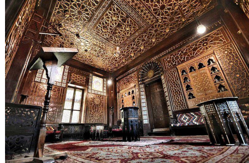
صورة (13) توضح حجرة استقبال كبار المصلين بسراي الاستقبال