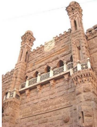
صورة (12) برجان يشبهان مداخل المآذن في بداية العصر الفاطمي علي جانبي أعلي مدخل القصر تطلوه شرفات للحراسة

يعتبر السوريون من العوامل المؤثرة التي ساهمت في نقل التأثيرات الأوروبية إلى مصر في القرن التاسع عشر وبداية القرن العشرين، وتعود جذور مجي السوريون إلى مصر إلى عهد محمد علي فقد هرب الكثير منهم إلى أوروبا في أعقاب الجلاء الفرنسي عام 1801 لكنهم بدأوا في المجي إلى مصر عندما حقق نظام محمد علي بعض الثبات، ولقد كانوا مفيدين علي وجه الخصوص في النظام التعليمي نظرا لتمكنهم من اللغة العربية واللغات الأوروبية بخلاف المعلمين الفرنسيين والإيطاليين (جاك كرابس جونيور، 1983، ص 251).