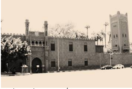
صورة (9) توضح قصر الأمير محمد علي من الخارج موقع القصر:

يقع القصر على ضفاف نهر النيل الشرقي بجزيرة منيل الروضة في مواجهة القصر العيني يقع قصر الأمير محمد علي (شارع السرايا بالمنيل)، وتبلغ المساحة الكلية للقصر حوالي 61711 متر 2 وتمثل مساحة المباني بما فيها السرايات منها 5000 متر 2 ، وباقي المساحة خصصت للحدائق والطرق الداخلية صورة (10).