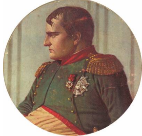
صورة (3) توضح الجنرال نابليون بونابرت

اللحظة المناسبة قد حان وأنها ولا بد من انتهازها، وقامت فرنسا بتجهيز الحملة الفرنسية علي مصر بقيادة الجنرال نابليون بونابرت صورة (3)، (www.faroukmisr.net).