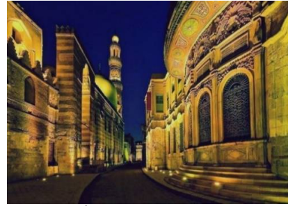
صورة (2) توضح القاهرة المعز

أما القاهرة بطرازها الحالي فيعود تاريخ إنشائها إلي الفتح الإسلامي لمصر علي يد عمرو بن العاص عام 641م وإنشائه مدينة الفسطاط ثم إنشاء العباسيين لمدينة العسكر ثم بناء أحمد بن طولون لمدينة القطائع، ومع دخول الفاطميين مصر بدأ القائد جوهر الصقلي في بناء العاصمة الجديدة للدولة الفاطمية بأمر من الخليفة الفاطمي المعز لدين الله، وعندما انتقل الخليفة هو وأسرته من المغرب إلي مصر عام 973م واتخذها موطناً له ومقر للخلافة أطلق عليها اسم "قاهرة المعز" (صورة 2)، وأطلق علي القاهرة-علي مر العصور-العديد من الأسماء، فهي مدينة الألف منقنة ومصر المحروسة وقاهرة المعز توفيق عبد الجواد، ص 309-315).