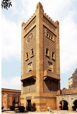
صورة (21) توضح برج الساعة

ويعتبر القصر من أهم القصور التاريخية التي شيدت في القاهرة الخديوية وما زال قائماً حتى الآن.