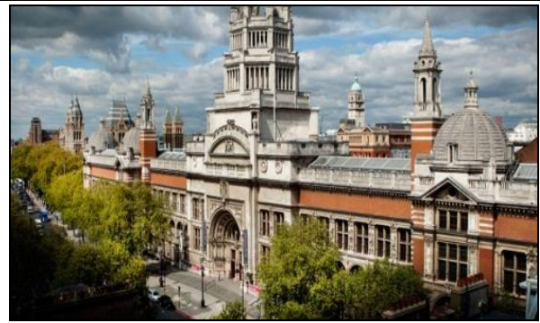
شكل (8) اتحف فيكتوريا والبرت ، تصميم دانيال لينسكيند ، لندن