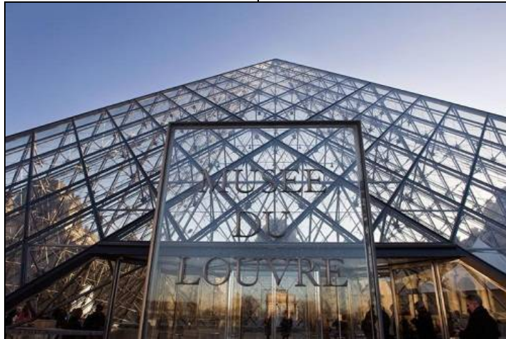
شكل (17) يوضح انعكاس هيئة المبنى التاريخي لقصر اللوفر على اسطح الهرم الزجاجي

وقد واجه المعماري مشكلة كبيرة فى خلق امتداد وإضافة مستجدة لا تضر بالقيمة التاريخية للقصر ، حيث توصل لاستغلال الفناء المركزى الواقع بين أجنحة المتحف وعمل امتداد غير مرئي من