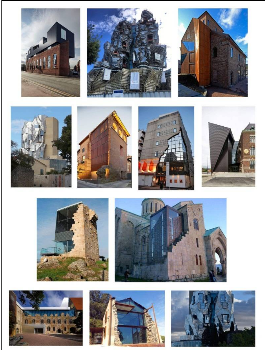
شكل (14) أمثلة معمارية حول العالم توضح الاختلاف بين التشكيل المعماري القائم والمستجد مما أدى الى تباين كلى لكلا التشكيلين

بعد التأثير الطفيف للحركات الحديثة على بيئة المباني فى أواخر