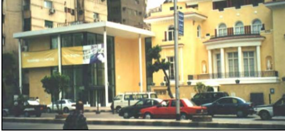
شكل (2) المركز الثقافي البريطاني بالعجوزة - القاهرة

مثال : المركز الثقافي البريطاني بالقاهرة :