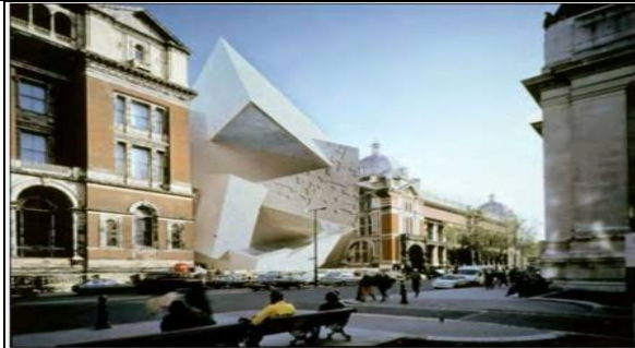
شكل (9) يوضح الإمتداد الحلزوني لمتحف فيكتوريا والبرت ، تصميم دانيال لينسكيند ، لندن

تستخدم هذه الطريقة عند الحاجة الى الإختلاف للتعامل مع تصميم