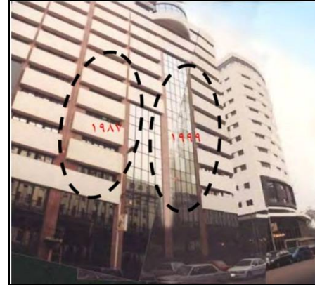
شكل (1) الملحق الجديد لمبنى الأهرام 1987م ، 1999م

مثال : الملحق الجديد لمبنى الأهرام - عام 1999م