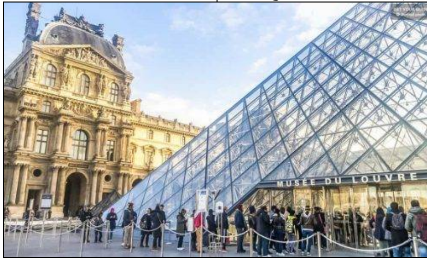
شكل (16) يوضح الهرم الزجاجي لمبنى متحف اللوفر الذى صممه اى ام باى ويعكس واجهات مباني عصر النهضة المواجهة له

عندما قرر الرئيس الراحل "فرانسوا ميتران" تطوير مبنى متحف اللوفر ، الذى اختير له المعماري الامريكى الصينى الأصل (I.M.PIE) الذى أنشأ الهرم الزجاجي وتمثل هيئته فراغ للامتداد