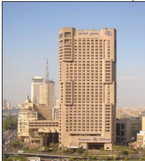
شكل (3-4) مبنى فندق رمسيس هيلتون - القاهرة