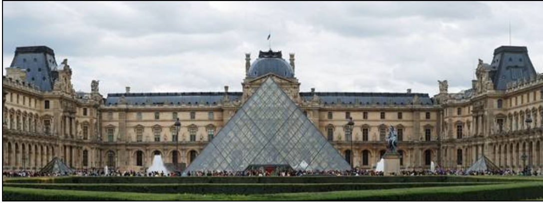
شكل (15) الهرم الزجاجي بداخل فناء قصر اللوفر القديم

الغير مرئي الذى يحوى الخدمات العامة للزوار . (Architectural Style, 2005)