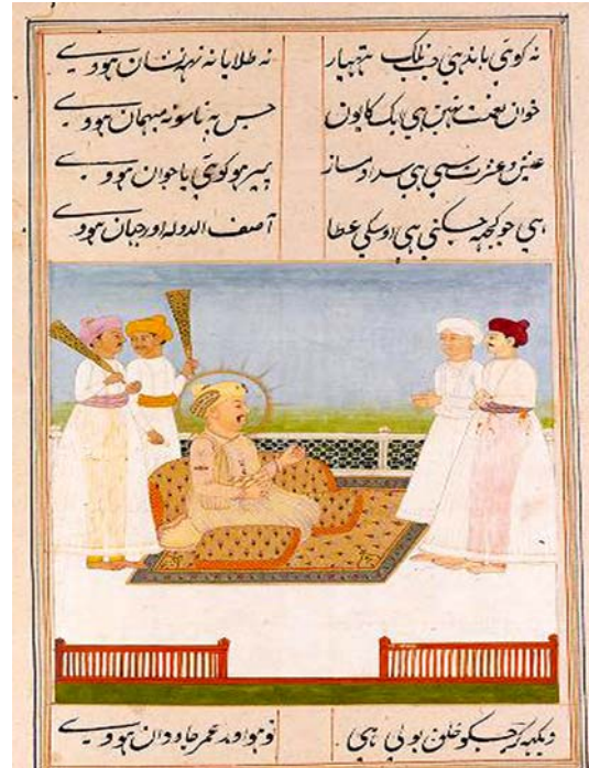
لوحة رقم (٨)

صورة من مخطوط (خمسة) لأمير خسرو الدهلوي، (الهند - لاهور - سنة ١٥٩٧م)، توضح الحورية وهي تستقبل شاب غريب بالحديقة محفوظة في متحف المتروبوليتان للفن بنيويورك تحت رقم (١٣-٢٢٨-٣٣)