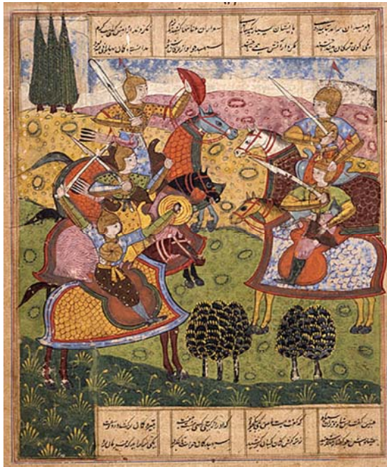
لوحة رقم (٢)

لقد أوجد أباطرة المغول في الهند مناخًا ثقافيًا مدهشًا وتقدم حضاري كبير مازال تأثيره واضحًا في شبه القارة الهندية إلى الآن، فكانوا رعاةً بحق للفنون والآداب والعلوم، وخصوصًا الأباطرة المغول الأوائل خلال القرنين السادس عشر والسابع عشر الميلاديين. ومنذ بدايات هذا العصر أصبحت اللغة الفارسية هي لغة البلاط والمثقفين والعلماء بشكل وحجم غير مسبوق، وكان الأدب الفارسي هو الحقل الأساسي للأدباء والشعراء المسلمين وكذلك للمثقفين بشكل عام في الهند آنذاك، وهذا علاوة على شغف الأباطرة المغول بالأدب والفن الفارسي، ويتضح ذلك جليًا في الإنتاج الكبير والمتنوع للمخطوطات الأدبية الفارسية الإسلامية وتزينها بالتصاوير والمنمنمات -المميزة لأساليب المدرسة المغولية الهندية- على غرار المخطوطات الفارسية الإيرانية (التيمورية والصفوية)، وذلك أدي إلى انتشار الأدب الفارسي في الهند على وجه غير مسبوق، مما ساهم بشكل كبير في انتشار الثقافة الإسلامية وتغلغلها في طبقات المجتمع الهندي، وهذا بجانب الدور الكبير الذي لعبه التصوف الإسلامي وطرقه في الهند خلال العصور الوسطى. وكنتيجة لهذا التمازج الثقافي بين المسلمين حكامًا ومهاجرين وبين الهنود أنفسهم؛ تولدت اللغة الأردية وأصبحت رويدًا رويدًا هي لغة الأدب والشعر، لتحل محل اللغة الفارسية على ألسنة المثقفين والأدباء وفي أعمالهم خلال النصف الثاني من العصر المغولي في القرنين الثامن عشر والتاسع عشر الميلاديين.