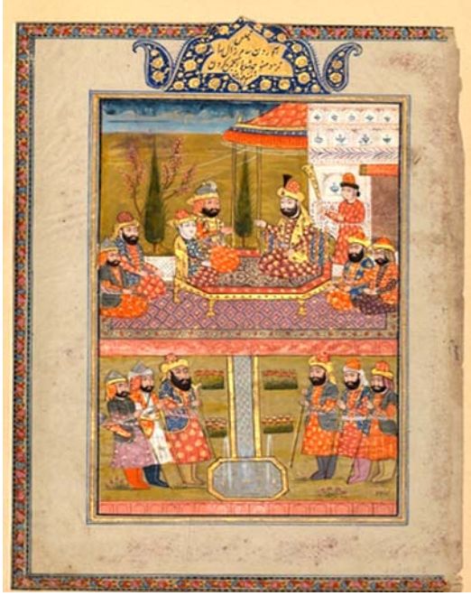
لوحة رقم (١)

صورة من مخطوط الشاهنامه، الهند - كشمير، أواخر القرن ١٩ م محفظة في متحف المتروبوليتان للفن بنيويورك تحت رقم (٦٨.٢١٥.٢٩)