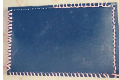
صورة (1) تقنية الجدل بأنواعه المختلفة