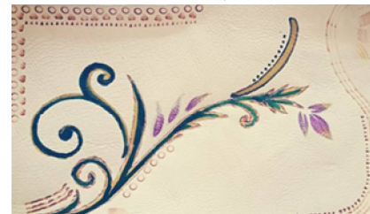
صورتي (6) تقنية الحرق والتلوين

الباحثان بتفريغ البيانات من واقع درجات محاور وبنود مقياس التقدير، وفيما يلي عرض لتلك النتائج في الجدول التالي .