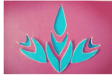
صورة (2) تقنية التفريغ والإضافة