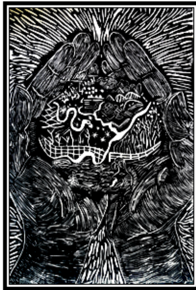
عمل فني طباعي رقم (١٥)