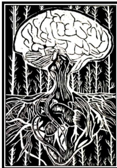
عمل فني طباعى رقم (٥)