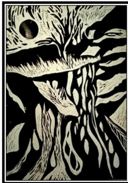
عمل فني طباعي رقم (١)