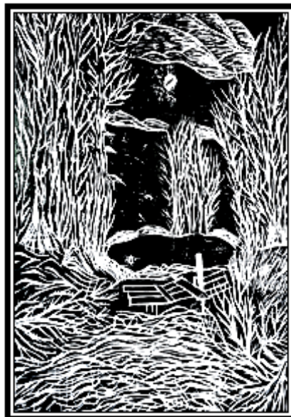
عمل فني طباعي رقم (٣)