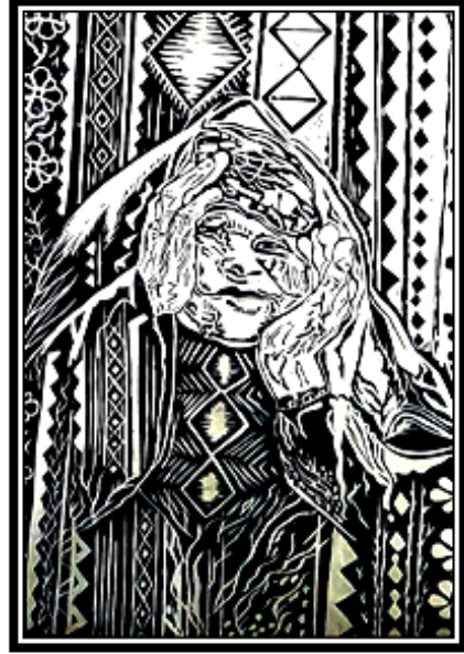
عمل فني طباعي رقم (١٧)