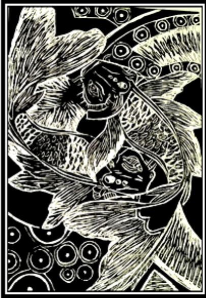
عمل فني طباعي رقم (٢٢)