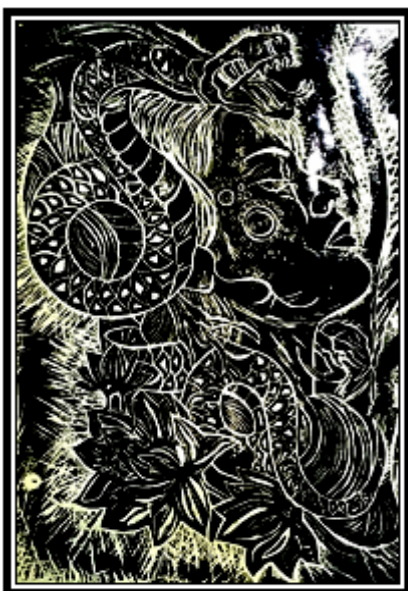
عمل فني طباعي رقم (١٢)