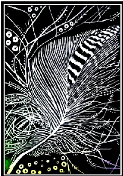
عمل فني طباعي رقم (٤)