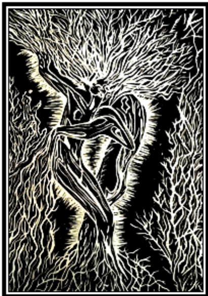
عمل فني طباعي رقم (٢)