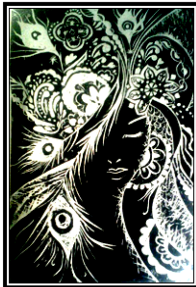
عمل فني طباعي رقم (١٣)