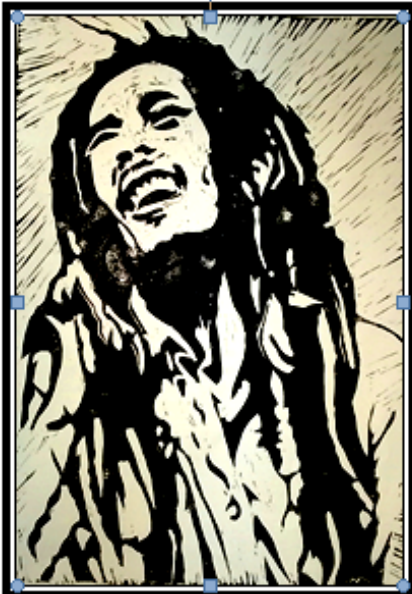
عمل فني طباعي رقم (٢٠)