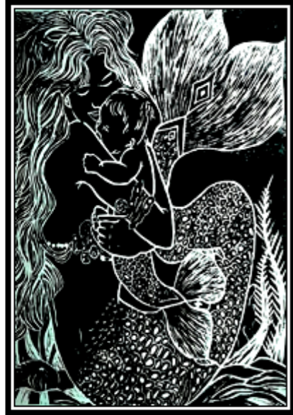
عمل فني طباعي رقم (٢١)