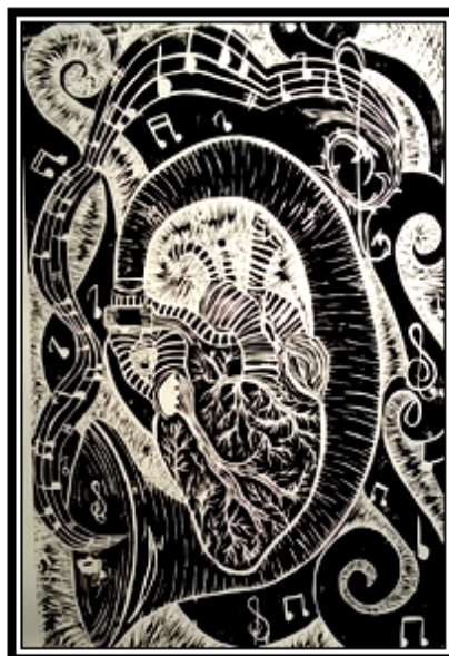
عمل فني طباعى رقم (٧)