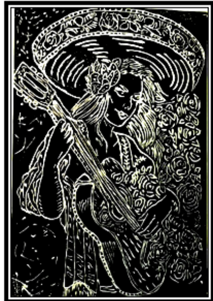
عمل فني طباعي رقم (١٩)