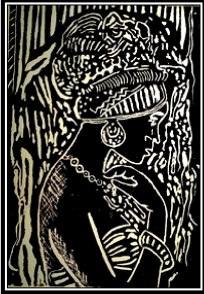
عمل فني طباعي رقم (١٨)