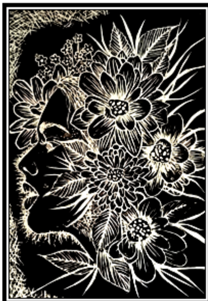
عمل فني طباعي رقم (١١)