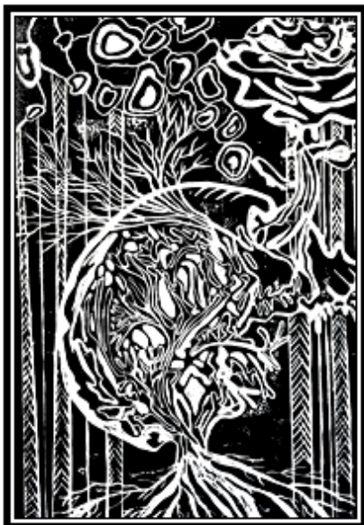
عمل فني طباعى رقم (٦)