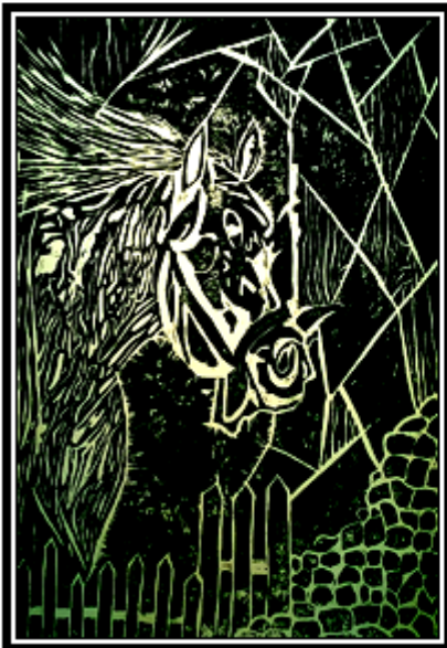
عمل فني طباعي رقم (٢٤)