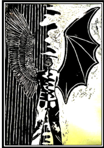
عمل فني طباعي رقم (٢٣)