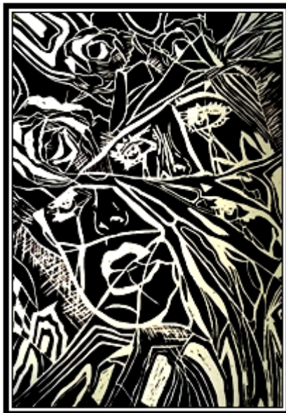
عمل فني طباعي رقم (٩)