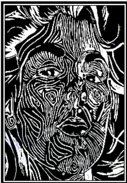
عمل فني طباعي رقم (١٠)