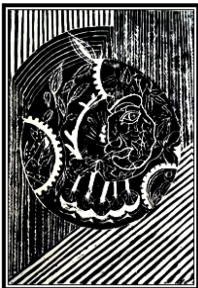
عمل فني طباعى رقم (٨)