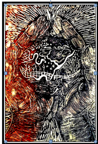
عمل فني طباعي رقم (١٦)