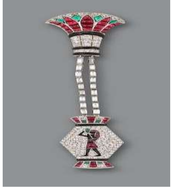
شكل ( ٥ )

تحليل المشغولة : أسست المشغولة على الأشكال الهندسية حيث لجأ الفنان للأشكال الهندسية لتضيف للمشغولة الرونق الجمالي مع استخدام الماس والبلاطين في الشكل الرباعي والنصف دائري ادي ذلك لظهور براعة الفنان ودقته في التنوع والربط من خلال الأسلاك والتكرار التبادلي في الألوان, كما تتوافر عناصر الحركة في الجزئين السفلي والعلوي كما استخدم بعض رموز الفن المصري القديم كالحارس وزهرة اللوتس حيث اجاد استخدامهما وتوزيعهم وخصوصا زهرة اللوتس التي يحملها الحارس اظهرت براعته.