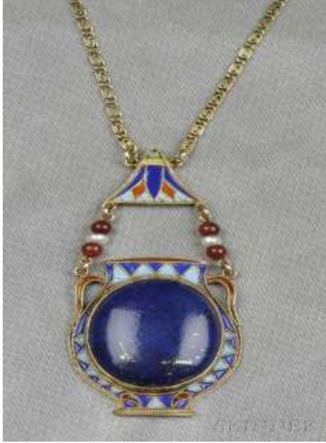
شكل ( ٧ )

حجر الزمرد الأزرق في البدن والعنق فوظف الخرز في شكل بسيط واستعان بالتكرار في الوحدات الهندسية ليضيف قيمة جمالية للمشغولة الفرعونية .