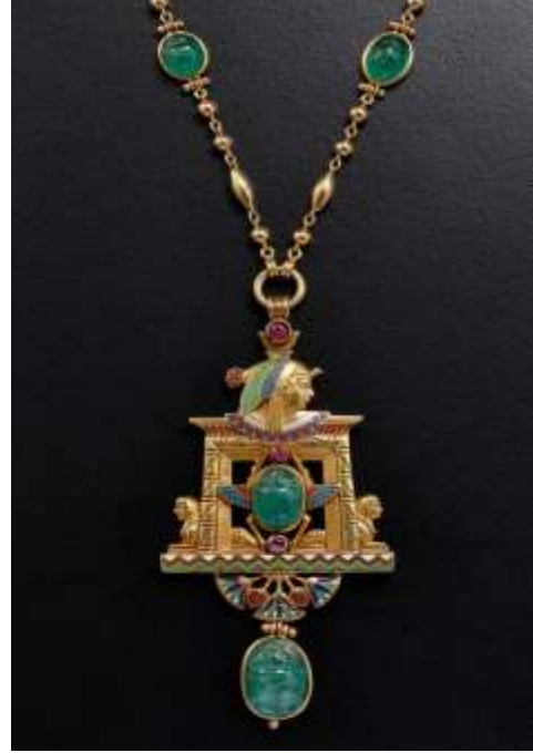
شكل ( ٦ ) قلادة من الذهب والزمرد واللؤلؤ والمينا

الخامات المستخدمة : الذهب والأحجار الكريمة العناصر المستخدمة: الثعبان المجنح، زهرة اللوتس، البردي، زخارف هندسية. تقنيات التشكيل : اللحام والتلميع والصقل والقطع