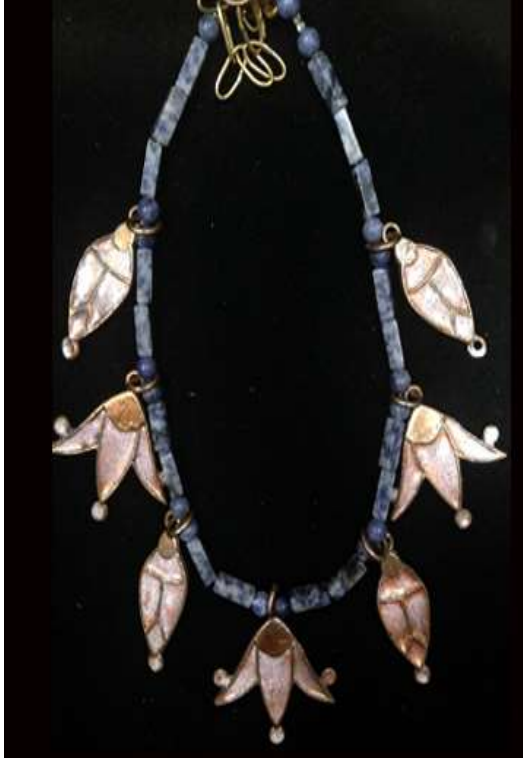
شكل ( ١٠ )

سوزان المصري, من البرونز والمينا ( الرابط )