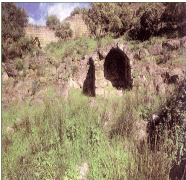
الشكل رقم (٢)