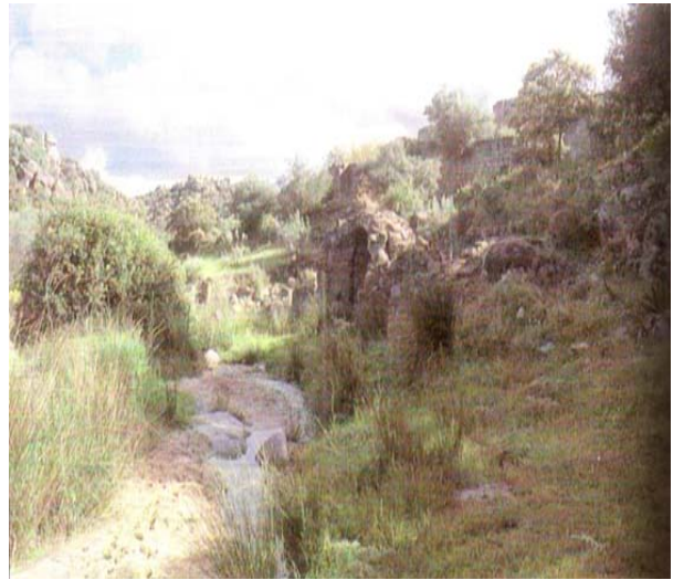
الشكل رقم (٣)