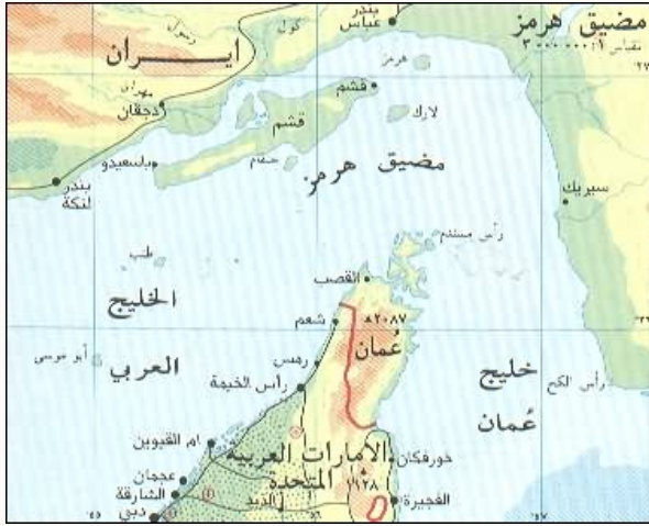
الملحق (١) مضيق هرمز