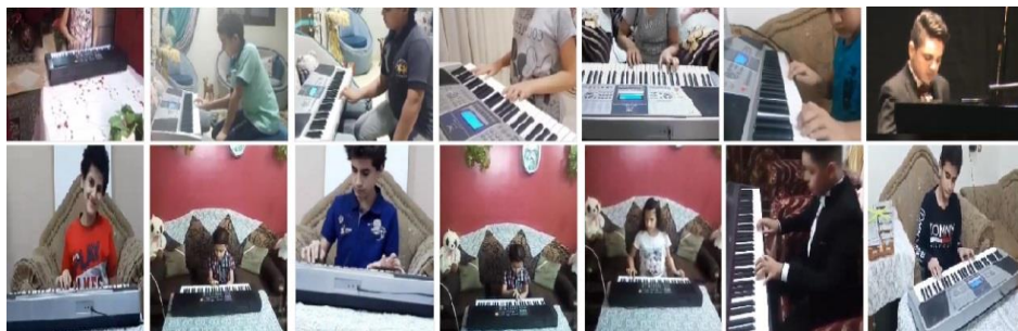
شكل رقم (13) يوضح صور بعض المشاركين الهواة