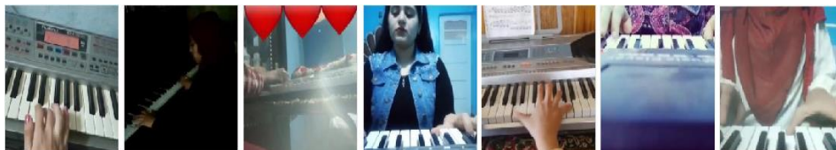
شكل رقم (12) يوضح صور بعض المشاركين من طلاب الكلية