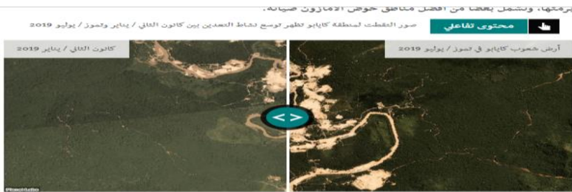
صورة رقم (١) توضح استخدام موقع بي بي سي للصور التفاعلية للمقارنة بين مناطق في حوض الأمازون في بدء الحرائق وبعد تدهورها على مدى عدة أشهر (٦٠) .

يتضح من الجدول السابق مجيء التقارير المصورة في المرتبة الأولى بنسبة ٦٩% حيث تزيد حاجة المستخدمين إلى المعلومات المصورة في مثل هذه الأحداث؛ لكونها توضح حجم وطبيعة الدمار الذي خلفته الحرائق، وجاءت ملفات الوسائط المتعددة في المرتبة الثانية بنسبة ٦١,٩% ، ويتفق ذلك مع دوافع استخدام لمبحوثين للمواقع، وبالفعل فقد زحرت المواقع الإخبارية بصور فوتوغرافية وصور عادية وتفاعلية بالأقمار الصناعية وإنفوجرافيك وفيديوجرافيك وخرائط ورسوم توضيحية تبين ضخامة الحرائق وتتبع ما خلفه من تدمير للغابات المطيرة (٥٩) . وجاءت التقارير الإخبارية في المركز الثالث ثم الأخبار القصيرة ثم القصص الإخبارية، بينما كانت المقالات والحوارات الصحفية أقل المواد الصحفية تفضيلاً لدى عينة الدراسة، وهو أمر له ما يبرره حيث تتزايد المواد الإخبارية على هذه المواقع مقارنة بمواد الرأي، كما أن النخبة العلمية بحكم طبيعة الثقافة والتخصص والعمل قد لا تميل كثيراً إلى قراءة الموضوعات المطولة ذات الطابع الأدبي مثل المقالات والحوارات بقدر ميلها إلى المواد القصيرة الموجزة مثل الأخبار.