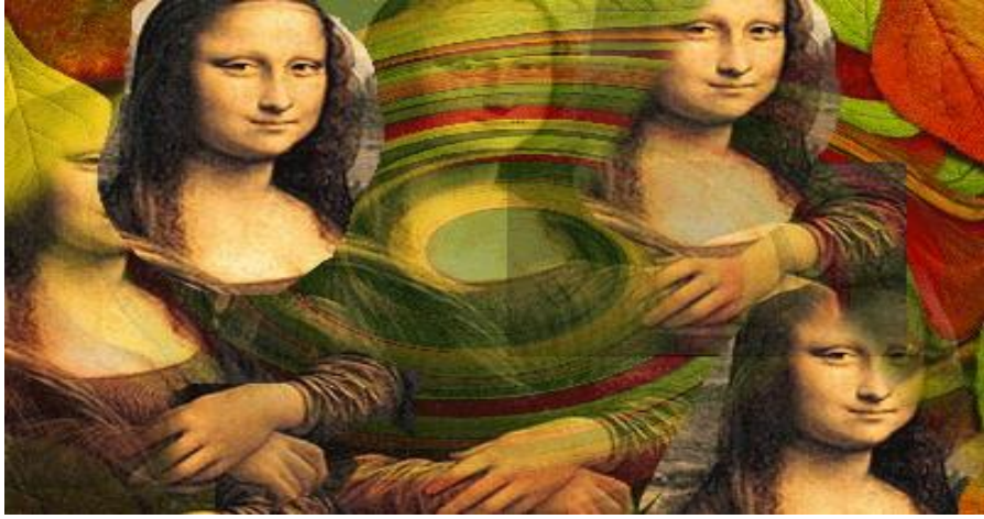
العمل الفني الثالث ( شكل ٣ )

داخل العمل وزيادة الايقاعات المتنوعة من الالوان ،ومع استخدام لوحة الموناليزا اكد على من خلال التكرار لوجه وايضا اجزاء اليد ،ومع وجود الشفافية في بعض الاجزاء الصورة ادى لثراء القيم التشكيلية والتعبيرية للوحة .