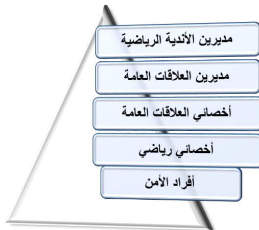
شكل ( ٢ ) فئات العينة المستخدمة في هذا البحث

و تمثلت في المديرين ( مديرين الأندية الرياضية ، ومديرين العلاقات العامة ) ، والهيئة المعاونة المتكونة من ( أخصائيين العلاقات العامة ، أخصائيين رياضيين ، وافراد الأمن بالأندية ) ، ويتضح ذلك من خلال الشكل التالي :