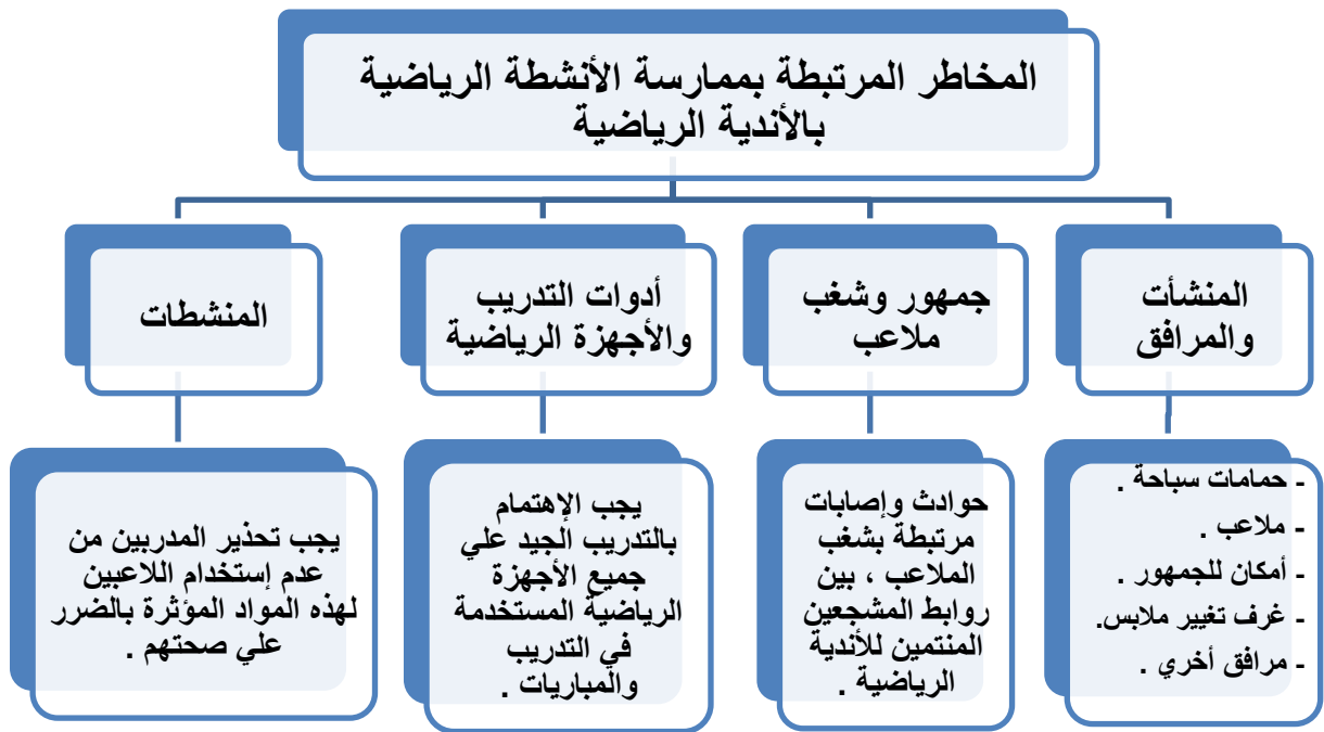
شكل رقم ( ١ ) من تصميم الباحثين يوضح فيه " بعض المخاطر المرتبطة بممارسة الأنشطة الرياضية بالأندية الرياضية "

وتحظر المادة (٣٣) " الرياضيين من تعاطي المواد المنشطة ، ولا يجوز مخالفة قواعد الوكالة الدولية لمكافحة المنشطات في مجال الرياضة ، كما يحظر علي المدربين والأطباء المعتمدين وغيرهم من العاملين في مجال الرياضة إعطاء المواد المنشطة للرياضيين ومطالبتهم وتحريضهم علي تعاطيها وتطبيق وسائل محظورة وفقاً لقواعد المنظمة الدولية لمكافحة المنشطات" ( قانون الرياضة ، رقم ٧١ لسنة ٢٠١٧ ) .