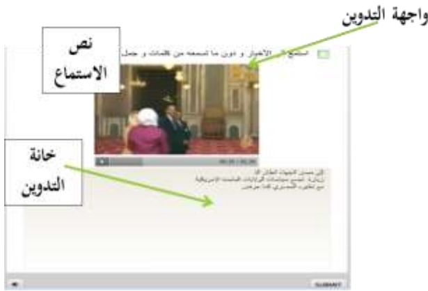
صور من درس الاستماع التفاعلي