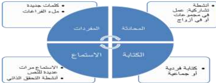
الشكل ٣: درس الاستماع التفاعلي والتعلم المدمج

تم نشر محتوى الدرس على المنصة التفاعلية "مودل" حيث تم استخدام وحدات النشاط المدمجة مع "مودل" بالإضافة إلى أدوات أخرى مثل: "أرنيكولات" و "فلاش" و "أدوب الاختباري" و "الفوتوشوب". تم تسجيل جميع المحتويات والإجابات الممكنة. عند تصميم هذا الدرس، تم تقسيم المهارات إلى تلك التي تُدرّس في الصف، وتلك التي كان الطلاب مسؤولون عن تعلمها عبر الشابكة.