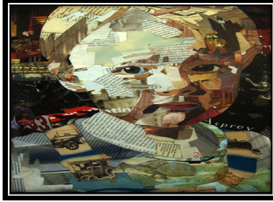
صورة (٣) توضح نموذج للكولاج ورقي

available at: http://zayzfon-mag.blogspot.com accessed at 21/4/2020