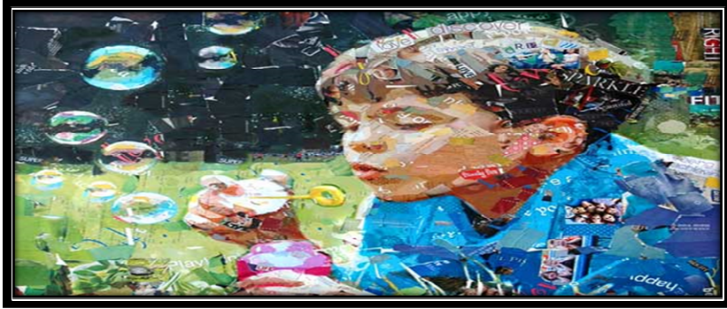
صورة ( ١ ) توضح نموذج كولاغ رقمي

available at: https://almalomat.com accessed at 21/4/2020