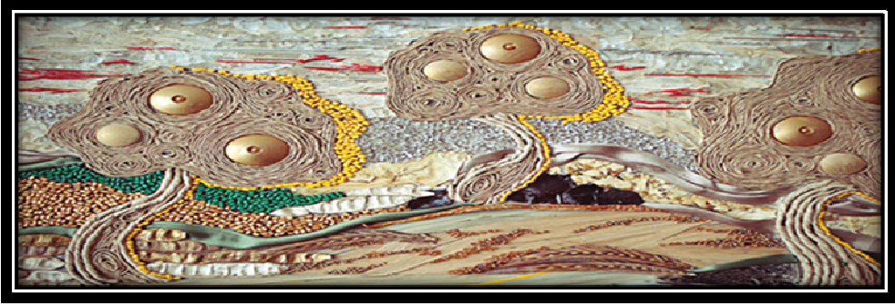
صورة(٧) توضح نموذج للكولاج الخشب

هذا النوع يكون حجمه صغير دائماً وينتج علي قماش فردي، ويتكون من قصاصات ونشارة من الخشب، والفكرة الرئيسية من الكولاج الخشبي هي استخدام الطبيعة لوصف العمل الفني available at: https://www.alyaum.com .accessed at 2114|2020