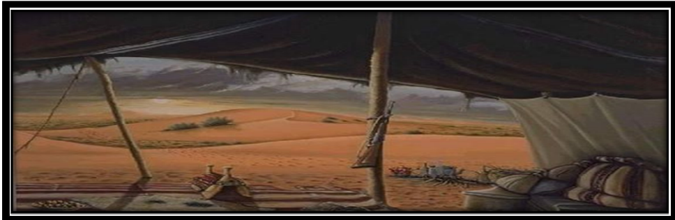
صورة (٦) توضح نموذج للكولاج رملي

وذلك بإحضار الورق المقوى والغراء الأبيض الشفاف والرمل، وقلم رصاص وفرشاة صمغ، ثم تقوم برسم التصميم الذي تريده على الورق المقوى، وتوزيع الغراء باستخدام الفرشاة، وبعد ذلك رش الرمال على الغراء، مع الحفاظ على التوزيع الجيد وعند الانتهاء قم بإزالة الرمال التي لا تلتصق بالغراء، ولإعطاء لمسة جمالية على الكولاج الخاص بك ننصحك بوضع ألوان جليتر لإعطاء لون للرمال. available at: https://www.alyaum.com .accessed at 2114|2020