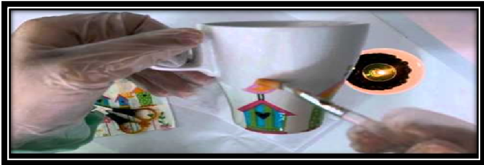
صورة (٨) توضح نموذج الديكوباج

available at: https://uniquewoman.net accessed at 2114|2020