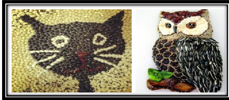
صورة (٤) توضح نموذج للكولاج طبيعي

available at: https://play.google.com accessed at 21/4/2020