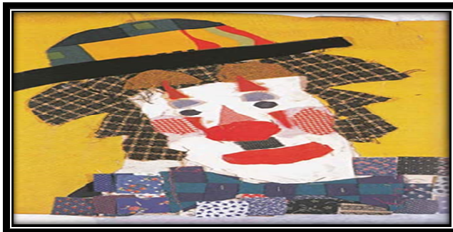
صورة (٢) توضح نموذج للكولاج اليدوي

available at: http://zayzfon-mag.blogspot.com accessed at 21/4/2020