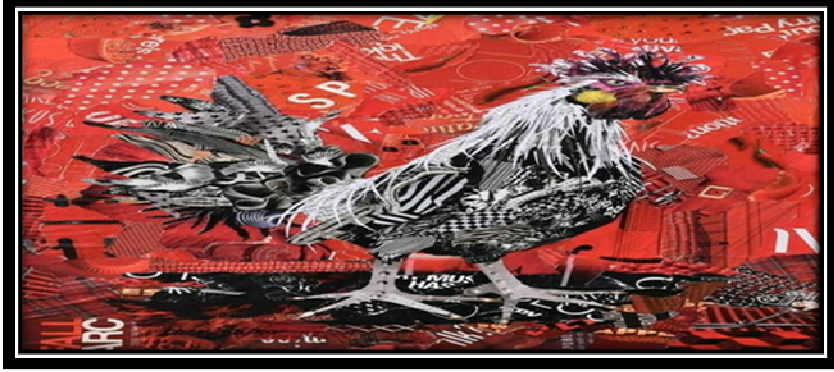
صورة (٩) توضح نموذج للكولاج الإلكتروني