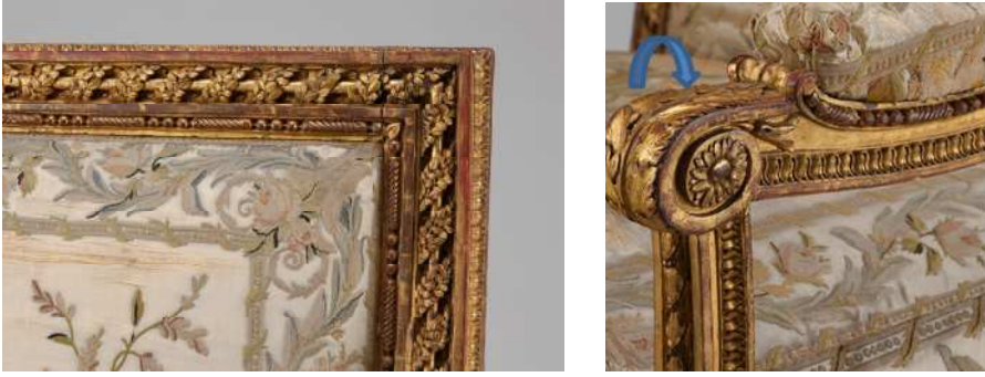
صورة (5) جزء من الظهر يوضح فروع نبات الغار تلتف حول محور إسطواني بشكل حلزوني ويوضح الإطار الخارجي المكون من ورقة الماء ويوضح الإطار الداخلي المحيط بالتنجيد

- المسافة بين المخدعين من الأمام من الداخل تساوي 3.63 سم وهي أكبر من المسافة بينهم من الخلف من الداخل والتي تساوي 4.52 سم حيث يشكل المخدع مع الظهر زاوية > 96^\circ .