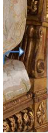
صورة (9) الجزء أعلي الأرجل الخلفية