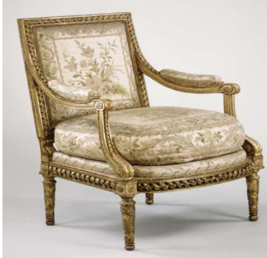
صورة (1) مقعد مسطح الظهر طراز لويس السادس عشر من تصميم جورج جاكوب موجود بمتحف مترو بولتان.